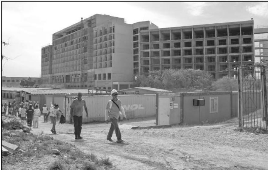
La industria turística despliega un programa de desarrollo paulatino hasta 2030, a fin de responder a la demanda cada vez más creciente del destino cubano.