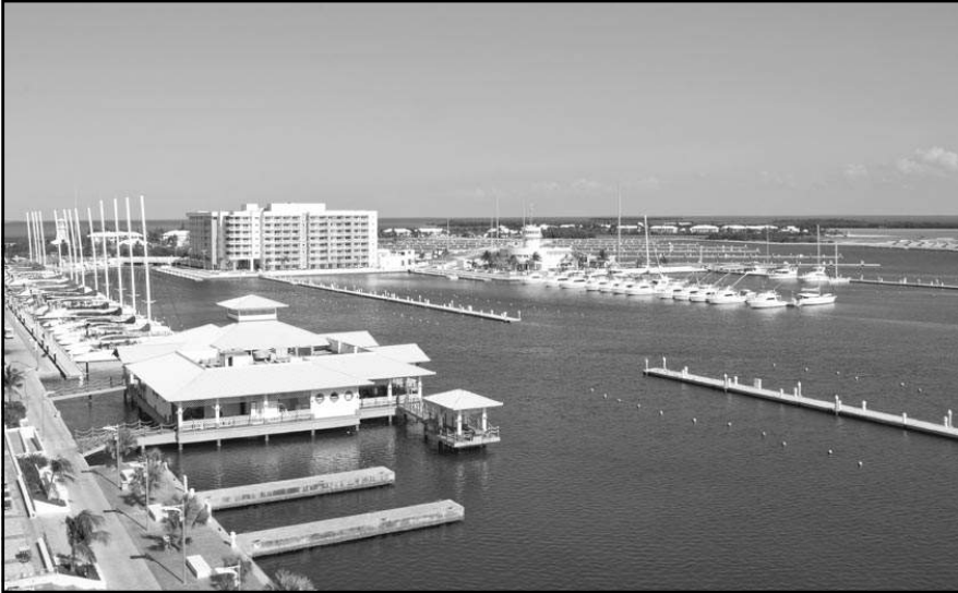
La náutica es una de las líneas potenciadas por el Mintur.