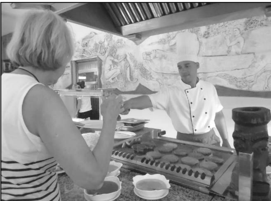
La calidad y variedad de los productos sigue incidiendo en la satisfacción de los clientes.

“El pasado 2015 –acota la directiva– afrontamos algunas dificultades con transporte, cuando la demanda superó la disponibilidad de vehículos, pero a finales de año tuvimos una reanimación a partir de inversiones de Transtur. En estos momentos estamos en condiciones más favorables”.