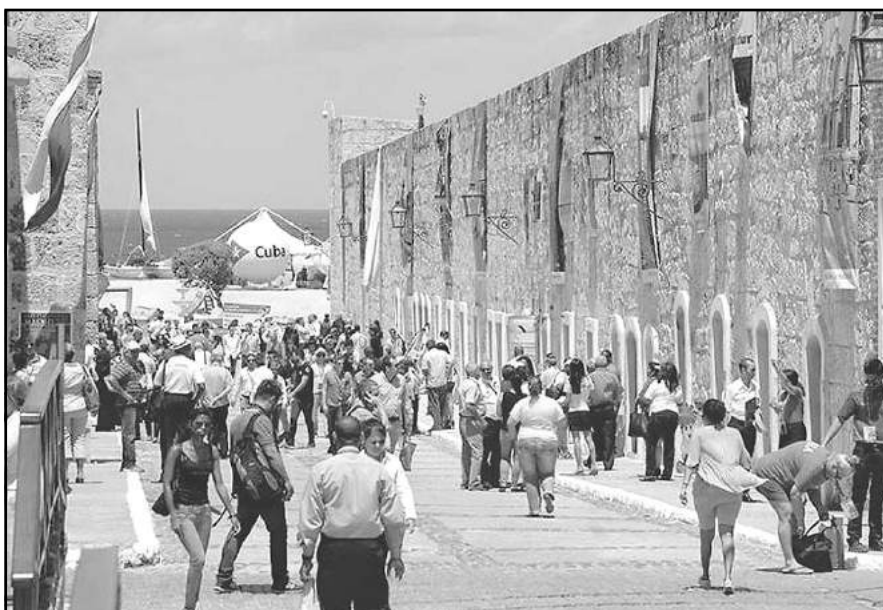
El impulso de la llamada industria sin chimeneas en Cuba quedó revalidado durante la recién concluida edición de la Feria Internacional de Turismo, celebrada en La Habana.

Sigue constituyendo una afectación importante para el desarrollo