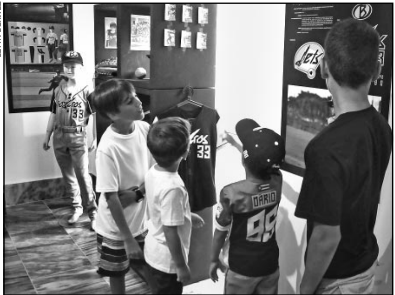
● El diseño, presente en todas las esferas de la vida.