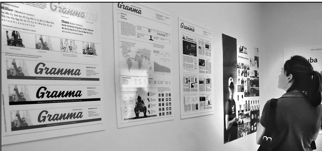
Ya los lectores esperan el periódico Granma de renovada estética, en el que participó el Grupo Creativo GC4 y el estudio del prestigioso argentino Rubén Fontana.