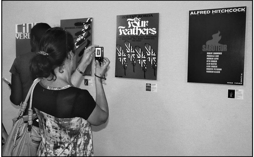
La exposición del notable cartelista, historietista e ilustrador de libros Rafael Morante –Premio Nacional de Diseño 2015– estará abierta en el Teatro Nacional hasta mediados de junio.