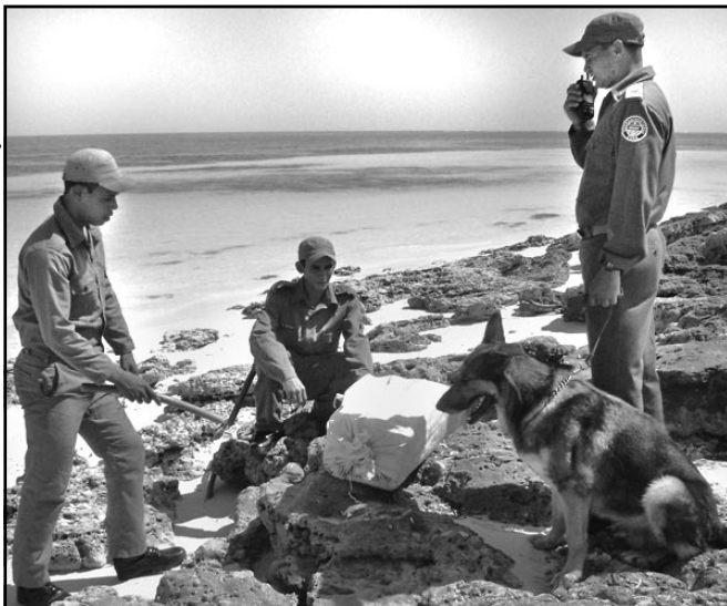
Cual centinelas insomnes, las tropas guardafronteras salvaguardan la integridad de nuestras costas ante amenazas externas como el narcotráfico internacional y el contrabando de personas.