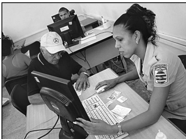
La Dirección de Identificación, Inmigración y Extranjería ofrece los servicios indispensables para consumir trámites migratorios.