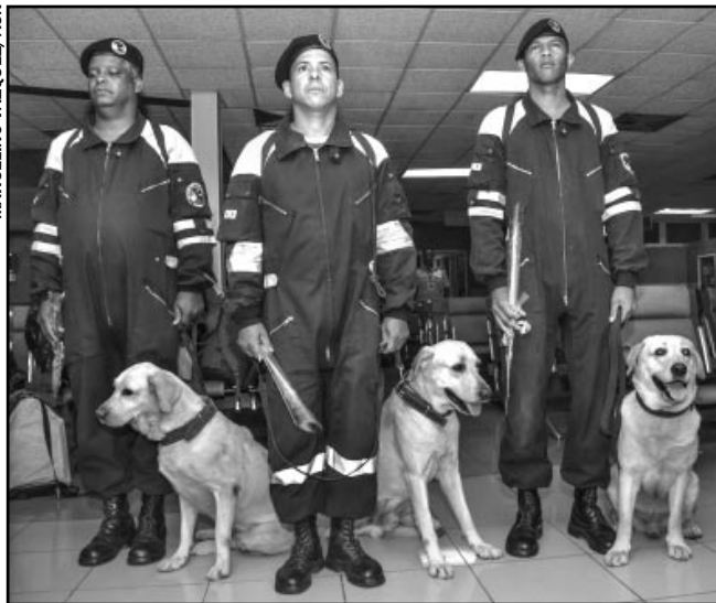
Con profesionalidad reconocida, una brigada cubana de rescate y salvamento prestó ayuda solidaria en Ecuador, tras el devastador terremoto de abril pasado.