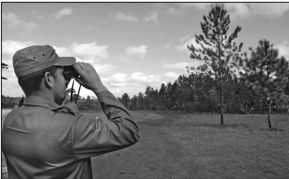
Los guardabosques realizan una misión tan arriesgada y sacrificada como el que más, en su combate contra los incendios forestales y las ilegalidades vinculadas al patrimonio natural.