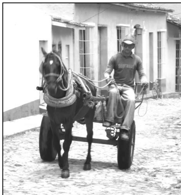
En Trinidad, cuando la sequía es brava, el agua también puede cargarse en coches de caballos.