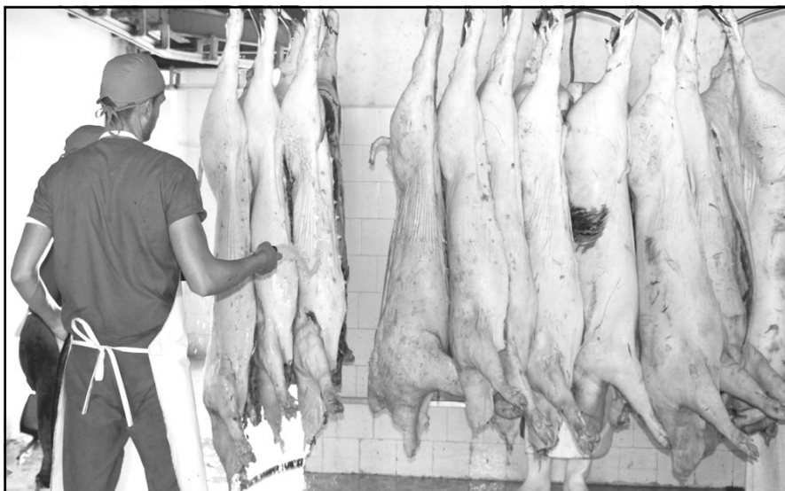
La carne porcina sustituye importaciones en Sancti Spiritus.

Al más avezado científico le costaría calcular cuántas viviendas, escuelas, hospitales, centros recreativos y deportivos, industrias o termina-