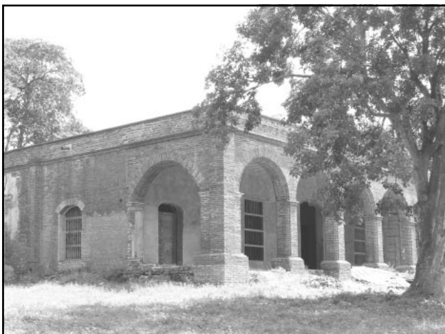
El Valle de los Ingenios atesora en sus alrededores ruinas de ingenios, casas de veraneo y barracones de esclavos.

Frente a las ruinas de los barracones del Valle de los Ingenios, las palabras