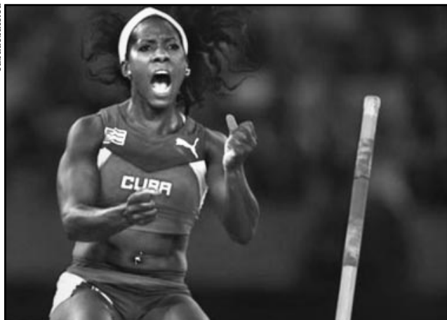
La pertiguista Yarisley Silva buscará escribir una nueva página de gloria en la capital carioca.