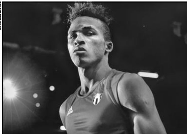
El triple campeón mundial Lázaro Álvarez está llamado a mejorar el metal bronceado de Londres.