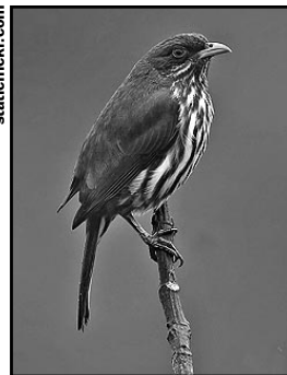
3. CIGUA PALMERA