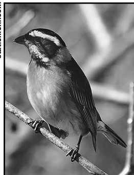
5. REINA MORA