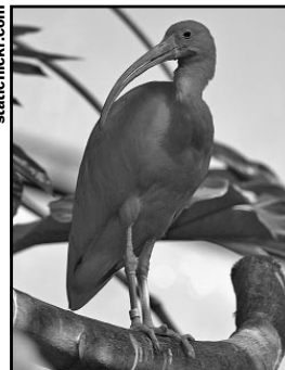
6. IBIS ESCARLATA