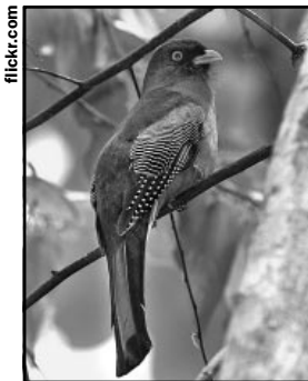
1. TROGÓN LA ESPAÑOLA

Aquí te presentamos algunos animales de la fauna caribeña con su variedad y multiplicidad. ¿A qué país pertenece cada uno de ellos?