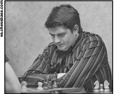
El Gran Maestro Pavel Ponkratov navega exitosamente en las dinámicas posiciones de la defensa Indo-Benoni.

El sistema defensivo que es utilizado por las negras en nuestra partida de hoy, se caracteriza por su dinamismo, es decir, las posibilidades latentes en la posición. El llamado "genio de Riga", Mijail Tal, un mago del juego de combinaciones, lo utilizó con frecuencia y exitosamente contra reputados oponentes, y fue una de sus armas preferidas para enfrentar 1.d4.