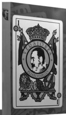
Versiones Eliseo Diego Ediciones Extramuros

Aparecen en este libro –según sus editores– experiencias vitales en que el autor logró disolver los límites entre la poesía y la prosa.