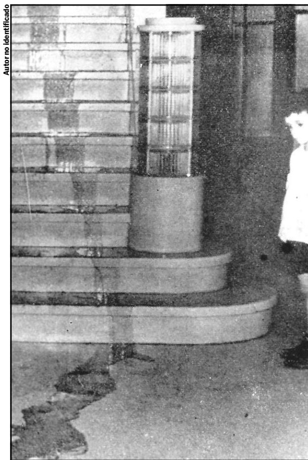
Autor no identificado

Por PEDRO ANTONIO GARCÍA / Fotos: Archivo de BOHEMIA