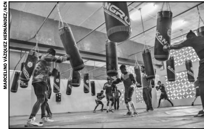
MARCELINO VÁZQUEZ HERNÁNDEZ/ACN

Y no pudo ser mejor escogida la fecha para la reinauguración del Complejo de Piscinas Baraguá: 13 de agosto (cumpleaños de Fidel). Es que los recuerdos se disparan. Allí estaba