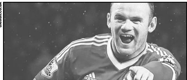
Rooney dice adiós a la selección inglesa.