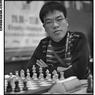
El afamado Gran Maestro vietnamita Le Quang Liem muestra sus habilidades en el juego de posiciones, para luego rematar con belleza esta partida.