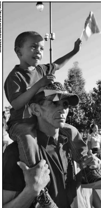
En el porvenir, la herencia de un pueblo digno conquistada por Fidel.