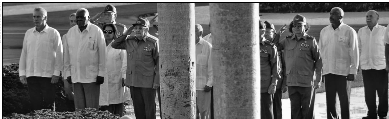
El presidente de los consejos de Estado y de Ministros, general de ejército Raúl Castro, junto a la máxima dirección del Partido y la Revolución, le rinde tributo al Comandante eterno.