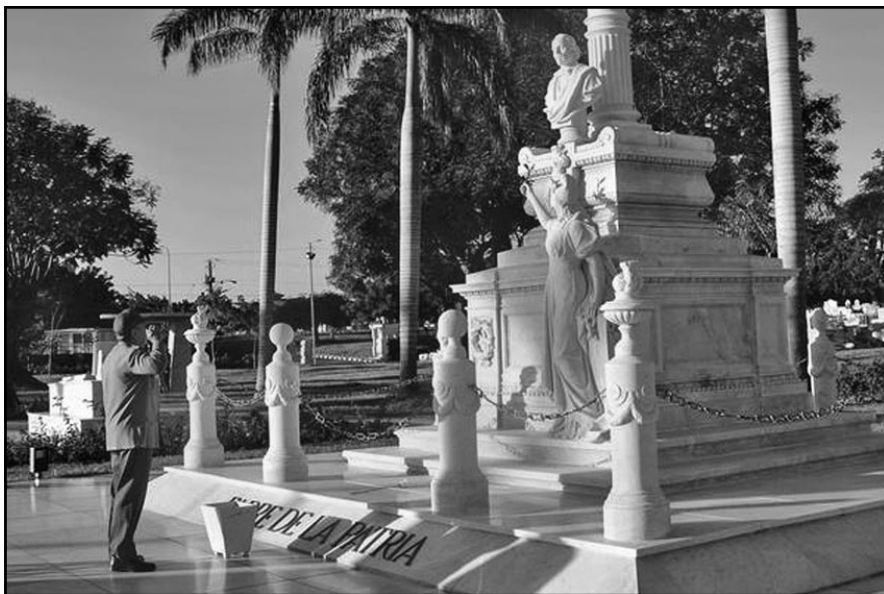
El homenaje de Raúl también para Carlos Manuel de Céspedes.