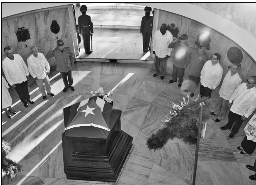
Rosas blancas depositadas en el monumento donde reposan los restos de José Martí, en señal de respeto y agradecimiento.