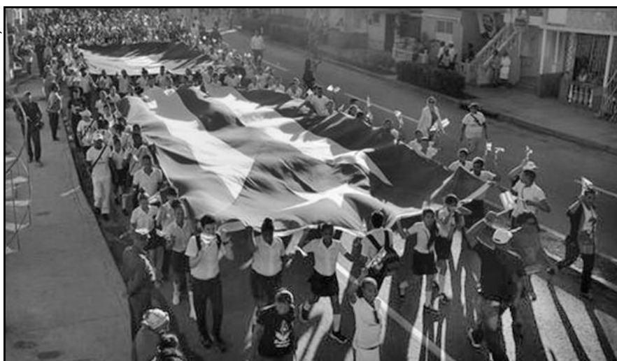
Una larga fila de santiagueros doblaba por la avenida de las Américas y llegaba a la calle Garzón, a casi dos kilómetros de distancia, para rendir tributo a Fidel a un año de su desaparición física.

Cuando los reporteros llegaron a la Plaza Antonio Maceo, alrededor de las seis de la mañana, el lugar ya se hallaba literalmente tomado por los pobladores de la ciudad heroica. La larga fila doblaba por la avenida de las Américas y llegaba a la calle Garzón, a casi dos kilómetros de distancia.