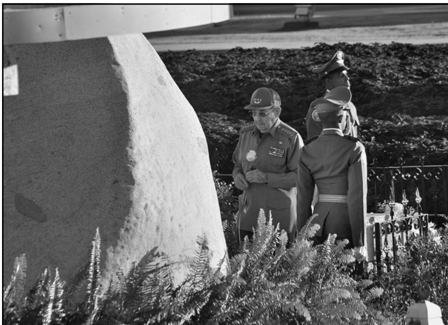
Momento de intensa emoción, en el que se resume la fidelidad al hermano, al jefe, al hombre que hizo grande a una pequeña Isla.