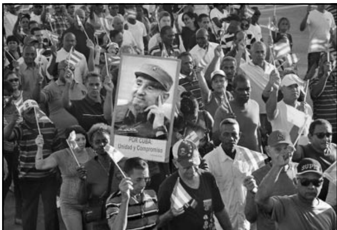
Todos hermanos, orgullosos del ejemplo de Fidel.