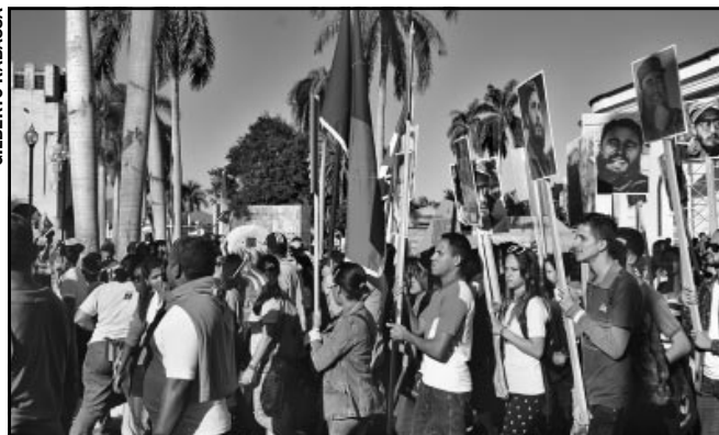
La peregrinación popular protagonizada por los santiagueros, en representación del pueblo de Cuba, demostró que sigue vivo el recuerdo del líder histórico de la Revolución Cubana.