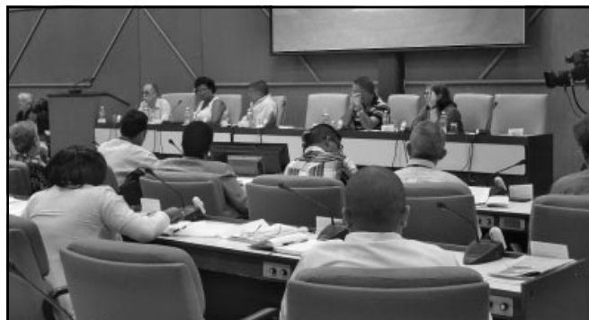
En la Comisión Agroalimentaria se analizó la producción de azúcar, tabaco y alimentos.

po. Reveló que a pesar de resultados positivos, prevalecen barreras para la adecuada gestión científica en función del desarrollo agrario.