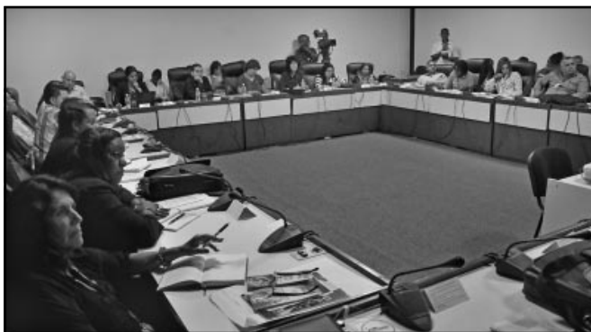
Los derechos de las trabajadoras por cuenta propia fueron aspectos considerados en la Comisión de Atención a la Niñez, la Juventud y la Igualdad de Derechos de la Mujer.