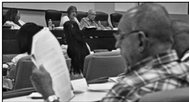
El comercio en la red minorista debe cerrar 2017 con un sobrecumplimiento de 487 millones de CUP, se informó en la Comisión de Atención a los Servicios.

participaron el secretario general de la CTC y miembro del Buró Político, Ulises Guilarte de Nacimiento, y otros invitados.