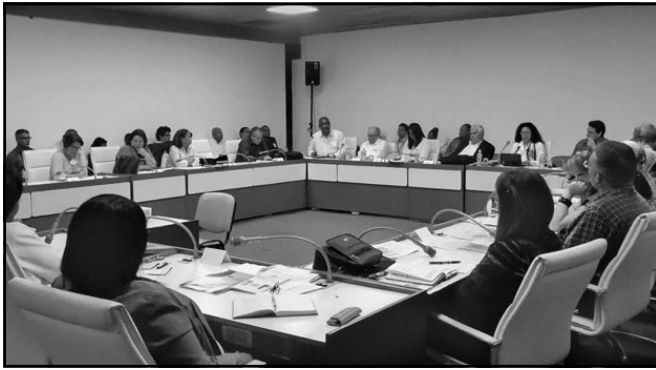
El país necesita un sistema jurídico altamente calificado, subrayaron en la Comisión de Asuntos Constitucionales y Jurídicos.