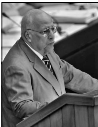
El ministro de Economía y Planificación, Ricardo Cabrisas, dijo que lograr 1.6 de crecimiento del PIB es signo de la tendencia gradual de la dinámica del desarrollo.