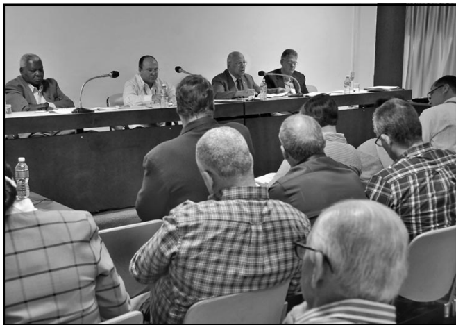
En la Comisión de Asuntos Económicos se destacó que si bien no se logró todo lo previsto, hay resultados favorables en varios sectores productivos.