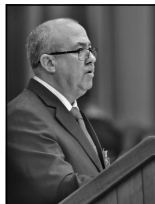
El fiscal general Darío Delgado, resaltó que la Fiscalía ha dado atención entre 2012 y 2016 a más de 148 000 quejas de personas que llaman a la Línea Única, envían cartas o acuden a sus Oficinas.