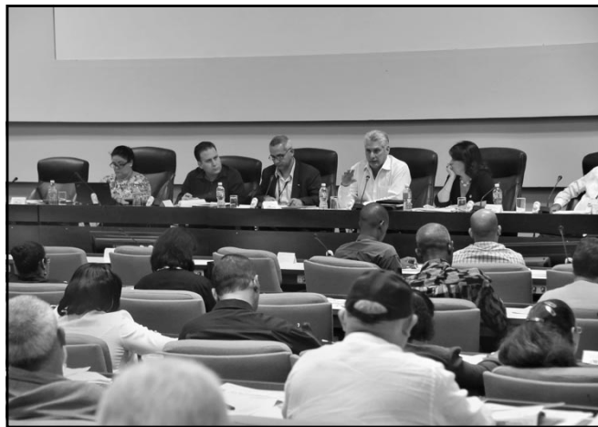
La Comisión de Educación, Cultura, Ciencia, Tecnología y Medio Ambiente resaltó la participación de directivos y profesores en las transformaciones de la educación superior.