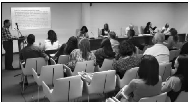
Los contratos en el béisbol; la baja cobertura o ausencia de medicamentos en farmacias y las ilegalidades en torno a estas producciones, entre otros temas, motivaron debates en la Comisión de Salud y Deporte.