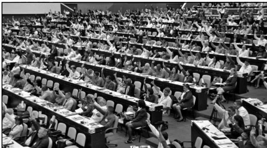
Los diputados aprobaron aplazar la toma de posesión de las asambleas provinciales y nacional para marzo y abril de 2018.

Cabrisas subrayó que el Plan de la Economía para 2018 deberá centrarse