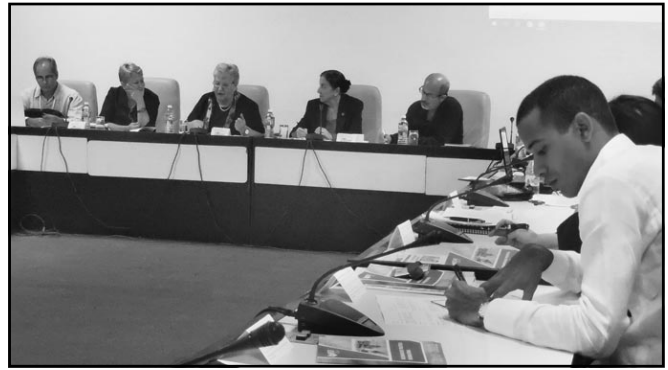
Para los integrantes de la Comisión de Relaciones Internacionales del Parlamento quedó claro que los Estados Unidos han elevado su hostilidad contra Cuba.

del Minag, y es primordial mejorar las condiciones de trabajo en el campo y en la industria.