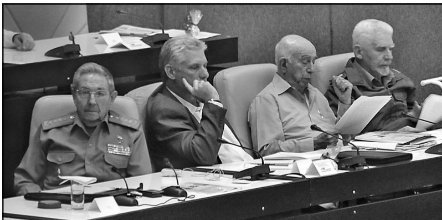
Raúl encabezó la última sesión ordinaria de este mandato de la Asamblea junto a los vicepresidentes y restantes miembros del Consejo de Estado.

vicepresidente y vicepresidentes, otros miembros del Consejo de Estado, además de la presidencia de Asamblea.