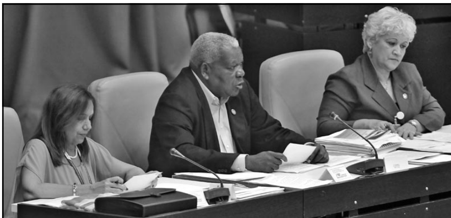
Esteban Lazo Hernández, presidente del Parlamento, pormenorizó el seguimiento que hacen los diputados a los planteamientos de la ciudadanía.

gramas de desarrollo e infraestructuras y demandas del Turismo. Por otro lado, se aseguran las actividades de salud, educación y servicios básicos a la población y de otros organismos cuyos presupuestos no son significativos, pero sí su interacción con la sociedad.