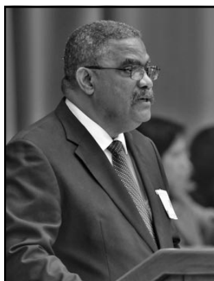
En su informe, el presidente del Tribunal Supremo Popular, Rubén Remigio Ferro, destacó el rigor que aplican los tribunales para los casos más graves de violación de la legalidad.