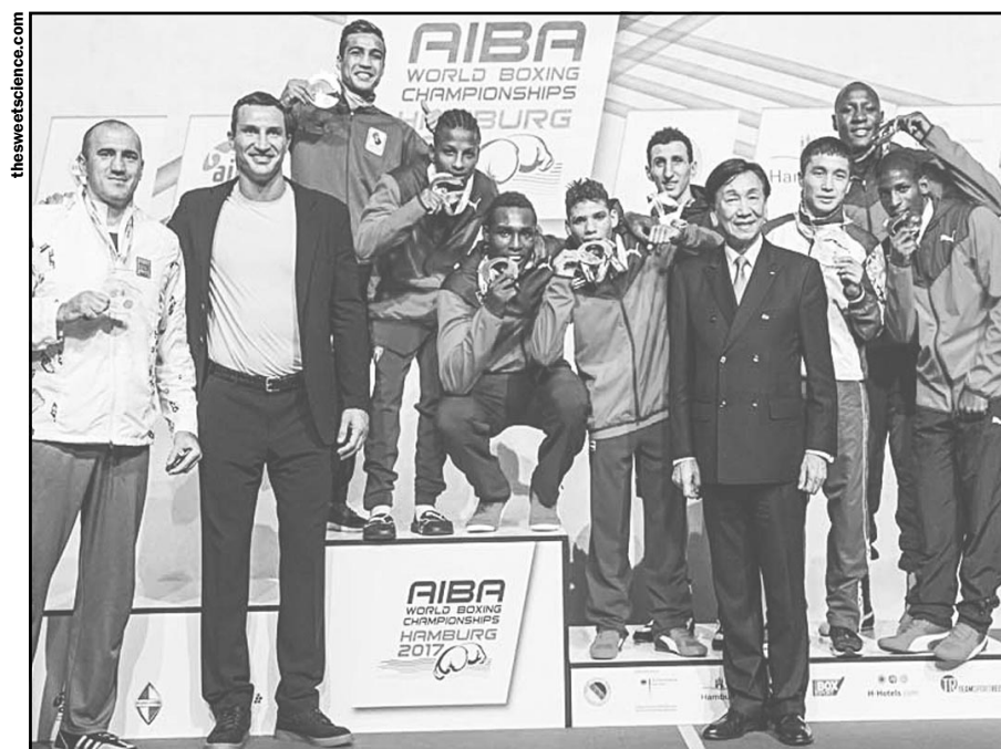
Los Domadores retuvieron la corona en el Campeonato Mundial y fueron el mejor equipo cubano de 2017.