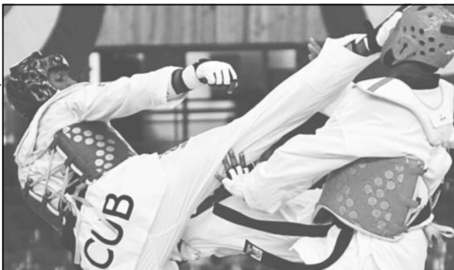
El taekwondo cubano quiere mejorar en Barranquilla la actuación de un oro y dos bronces de Veracruz 2014.

Ese fue, en resumen, nuestro panorama deportivo en el año que acaba de finalizar. Los telescopios se dirigen ahora hacia la ciudad colombiana de Barranquilla. Allí se disputarán los ya esperados Juegos Centroamericanos y del Caribe, donde Cuba aspira a mantener la hegemonía que presume desde 1970. ●