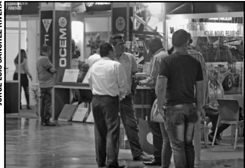
Más de una veintena de países participaron en la XII edición de la Feria Internacional de las Construcciones (Fecons 2018).

Según Olivera, antes que concluya el presente año, un número importante de estos proyectos estarán en ejecución. A su juicio, es muy importante la participación de entidades extranjeras en los contratos de asociación, porque el país necesita incrementar su capacidad constructiva, liquidez financiera, nuevas tecnologías, saber hacer (know how), y algo muy importante: compartir los riesgos y avatares de cualquier obra.