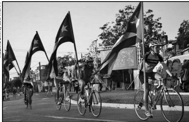
Las bicicletadas se extendieron por varias provincias del país.