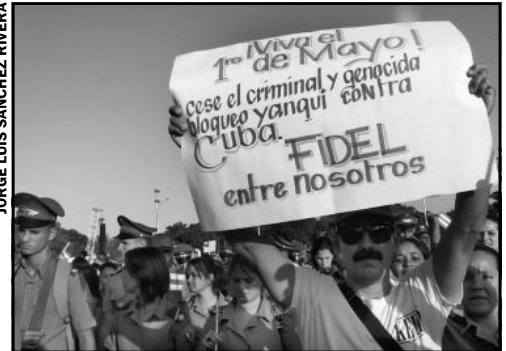
La celebración del 1° de Mayo será nuevamente una demostración de apoyo a la Revolución, y un espacio de homenaje a su líder histórico Fidel Castro.

ciones Tecnológicas y Desarrollo Nuclear evaluaron, en La Habana, las posibilidades de modernizar equipos de imagen de esta institución, así como las cámaras gamma que prestan servicio en el Sistema Nacional de Salud. De ese encuentro trascendió que se trabaja en la creación de un Centro de Referencia Nacional para la modernización de dichas cámaras, y en la digitalización de cuatro equipos que funcionan en el Centro de Isótopos. También se proyecta el montaje de este equipamiento en el Instituto Nacional de Oncología y Radiobiología, así como en los hospitales Clínico Quirúrgico Herma-