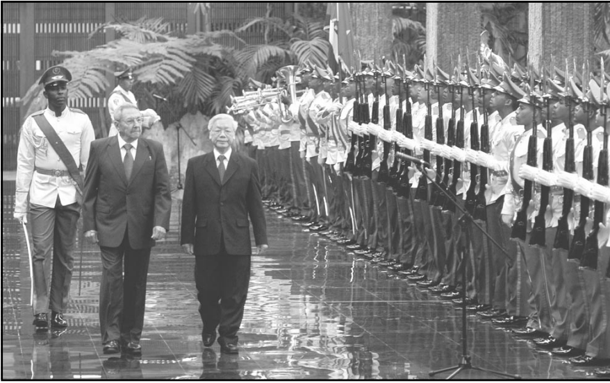
En un clima fraternal y amistoso, Phu Trong y Raúl reafirmaron el carácter histórico de las relaciones bilaterales.

Fidel Castro Ruz en 1973, que incluyó las zonas recién liberadas, cuyo aniversario 45 se conmemora en este 2018. Seguidamente, se firmaron importantes acuerdos de carácter gubernamental y empresarial.