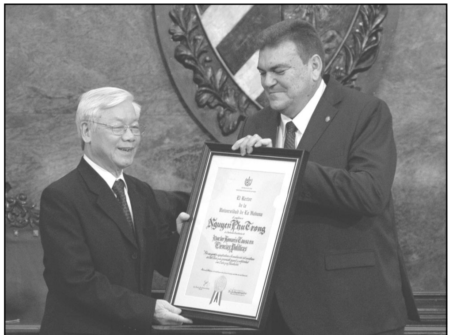
El secretario general del Partido Comunista de Vietnam recibió el Título de Doctor Honoris Causa en Ciencias Políticas de la Universidad de La Habana.

Citó al Comandante en Jefe de la Revolución, admirador de las proezas de ese pueblo asiático y defensor de su noble causa, cuando el 31 de octubre de 1982, ocasión en que se le impuso la Orden Estrella Dorada, expresara: “como pequeños ríos nacieron distantes y corrieron largo tiempo, entonces accidentados y solitarios, así marcharon nuestros pueblos hasta entroncarse un día en el río ancho e impetuoso de la revolución socialista”. ●