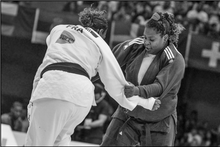
El judo de Barranquilla será prestigiado por una de las mejores exponentes del orbe: la campeona mundial y olímpica Idalis Ortiz (derecha).