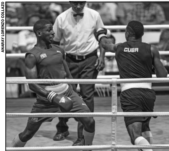
El campeón mundial Andy Cruz (izquierda) debutará en Juegos Centroamericanos y del Caribe.

La esgrima debe aprovechar esta competencia centroamericana para comenzar a recuperar el terreno perdido. Aljadis Bandera, comisionado nacional, consideró bueno el año de ese deporte en Cuba, sobre todo por