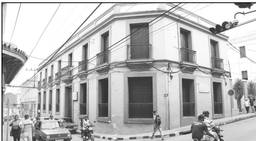
Centro de Estudios Antonio Maceo Grajales, ubicado en la calle San Félix, esquina Aguilera en el casco histórico de Santiago de Cuba.

Asimismo, reconoce como otro de los argumentos para la creación de la institución la preponderante visión militar que sobre Antonio existía en la historiografía, y la ne-