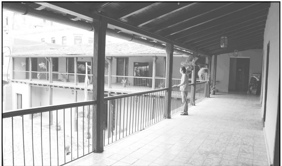
Patio interior del edificio.