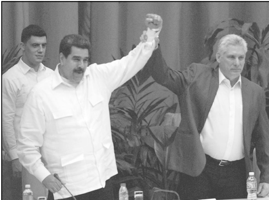
La amistad y la solidaridad entre hermanos: Díaz-Canel y Maduro.

Seguidamente Li Qiang, miembro del Buró Político del Comité Central del Partido Comunista Chino y primer secretario en Shanghái, expresó satisfacción con el desarrollo de