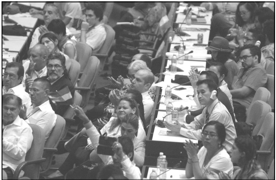
Diversa fue la participación.

“En este contexto, como en 1993 lo hizo Fidel, desde Cuba retomamos la bandera de la integración latinoamericanista y caribeña, esta vez con el objetivo estratégico de lograr la preservación de la Celac y de los demás proyectos integradores inspirados en valores de soberanía y lucha por la autodeterminación de la región, y como causa unitaria que las fuerzas de izquierda deberíamos