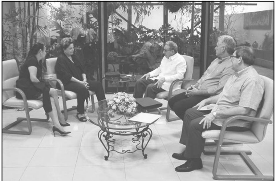
La reunión también fue escenario de encuentros, como el sostenido entre Raúl y Díaz-Canel con la compañera Dilma Rousseff, así como con otras personalidades asistentes al Foro.

Puntos focales en la coincidencia de las diversas intervenciones fueron el apoyo a la búsqueda de la paz en la Nicaragua sandinista asediada por elementos terroristas de la oposición, el rechazo a las tentativas de Estados Unidos y la descomunal agresión contra la hermana República Bolivariana de Venezuela, el respaldo a los procesos políticos alternativos en Bolivia y El Salvador,