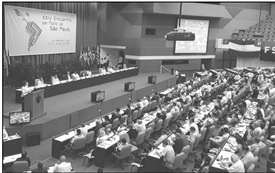
El Foro de Sao Paulo dialogó sobre urgentes temas de la región.

También hizo una evaluación de la compleja situación que enfrenta la región, sobre lo cual señaló que lo acontecido en estos años muestra