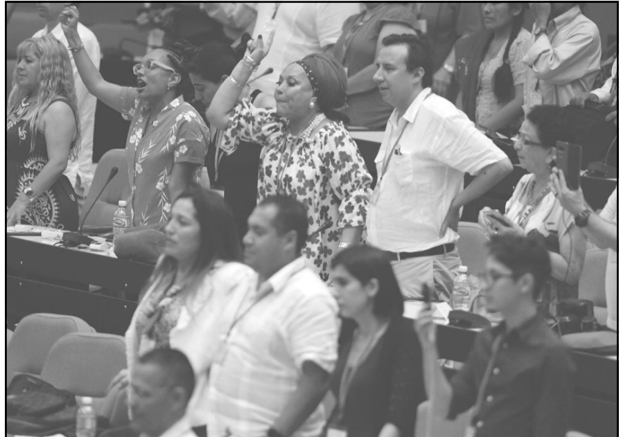
Las resoluciones surgieron de los intercambios.

Horas antes fueron presentadas las ideas contenidas en más de 40 resoluciones que brotaron de los encuentros sectoriales y talleres realizados, dedicados a las mujeres, los jóvenes, los parlamentarios, la comunicación política y los medios, el arte y la cultura. De igual modo se conceptualizaron también los debates generados en la Reunión de la Red en Defensa de la Humanidad,