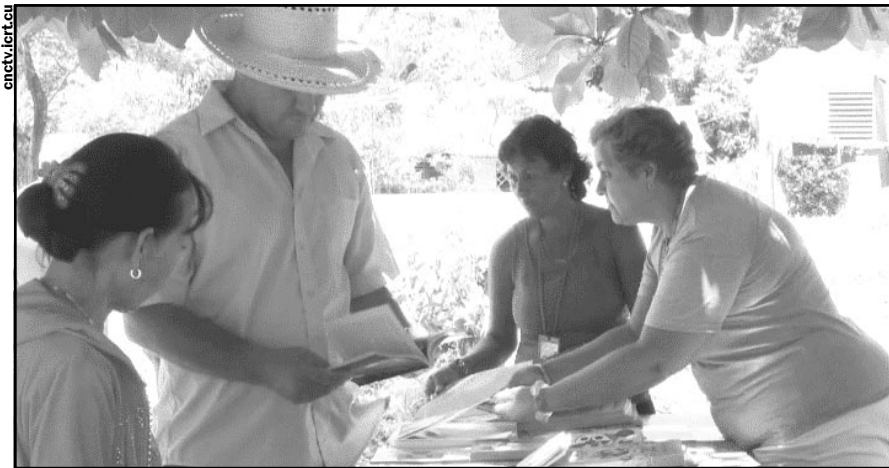
Festival del Libro en la Montaña, en el territorio de Guisa.

Así, la Editorial del Campo se afianza en el terruño de Guisa, con sus puertas y ventanas abiertas a los pobladores de las montañas, esos que también tienen interesantes historias por contar. ●