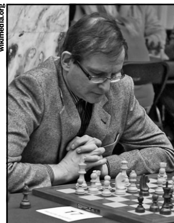
Las piezas fuera de juego llevan al Gran Maestro ucraniano Michal Krasenkow a una aplastante victoria.