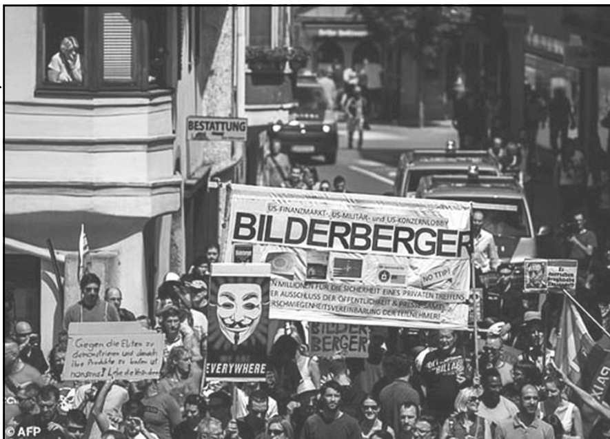
Imagen de una manifestación contra el Club Bilderberg.

cualquier acontecimiento político o social, razón por la cual hay miembros en las instituciones clave, como el Consejo de Relaciones Exteriores, en el Senado, la CIA, entre otros.