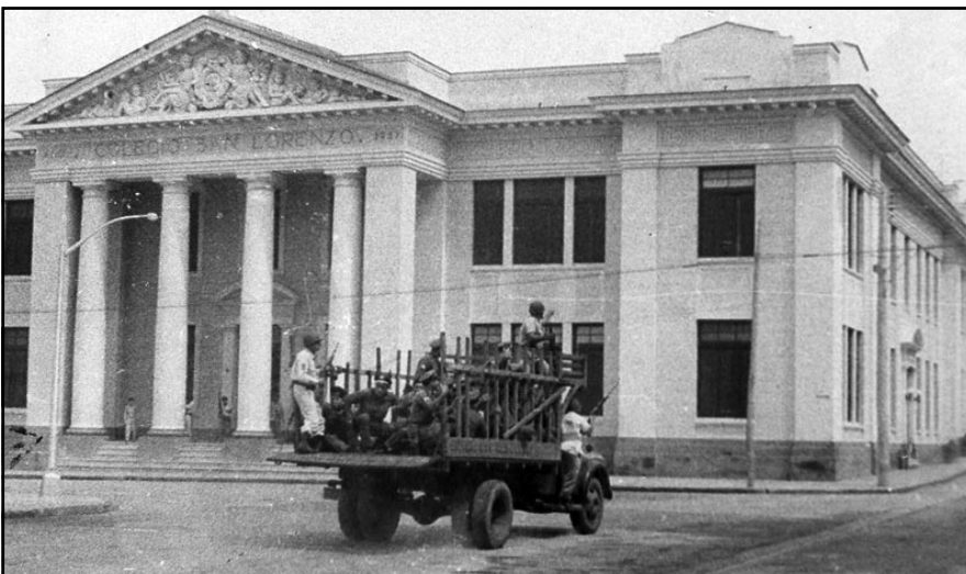
El Colegio San Lorenzo, según una foto de la época, fue escenario del heroísmo de revolucionarios, marinos y gente de pueblo.