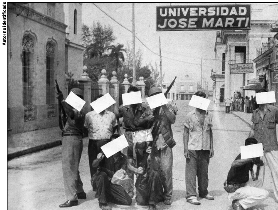
Foto del levantamiento en Cienfuegos publicada por BOHEMIA en la época. Por motivos obvios, se enmascaró a los revolucionarios.

EL inicio de la lucha guerrillera en la Sierra Maestra, bajo la dirección del Comandante Fidel Castro Ruz, exigía igual camino en el resto del país, idea que fue ratificada en la reunión de la Dirección Nacional del Movimiento 26 de Julio en febrero de 1957.