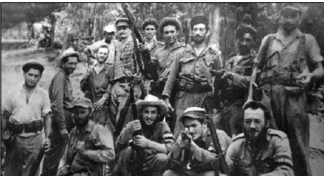
Integrantes de la Columna 13 Ignacio Agramonte, perteneciente al Frente Camagüey.