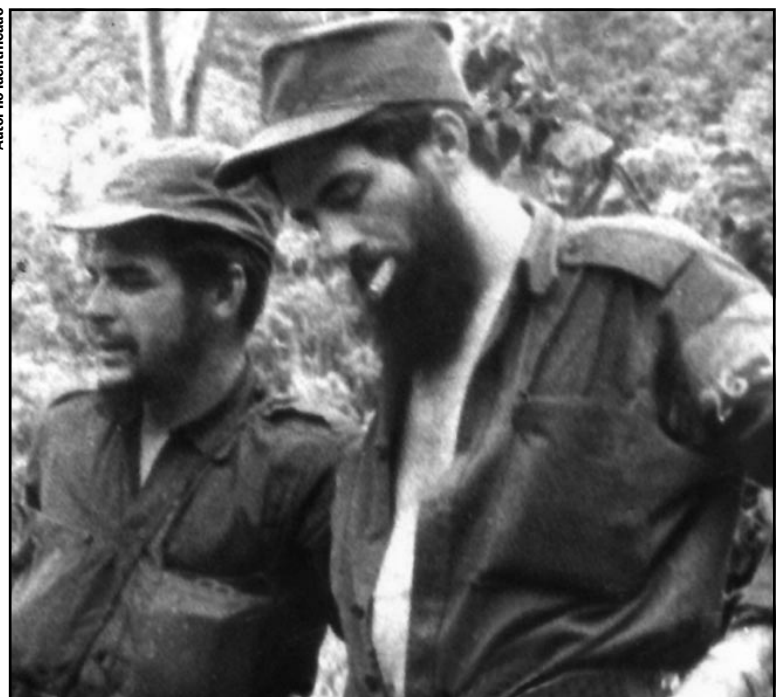
Por órdenes del Comandante en Jefe, Che y Camilo partieron con sus respectivas columnas hacia el centro del país.