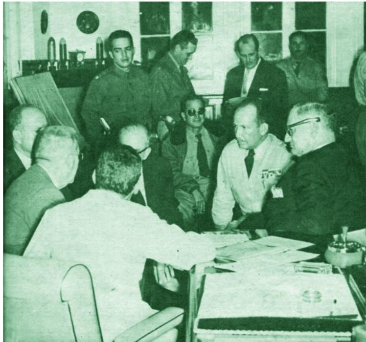
La Junta recién elaborada.

L OS acontecimientos que sucedieron a la fuga de Batista y sus amigos fueron trascendentes. Muchas cosas ocurrieron en el Campamento Militar de Columbia. El público, sin embargo, desconocía hasta estos instantes el verdadero drama que se desarrollaba en la madrugada del 1.º de enero y en horas posteriores. BOHEMIA, con carácter exclusivo, publica ahora la información completa de esos sucesos importantes.