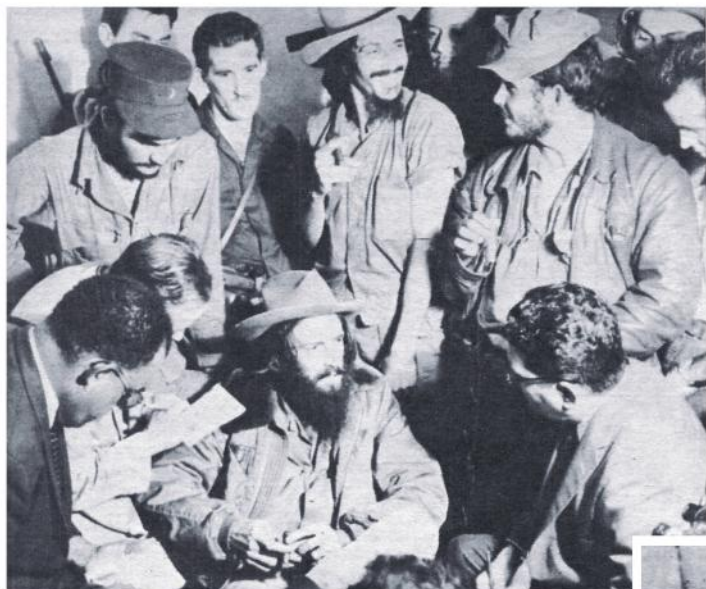
El comandante Cienfuegos habla.