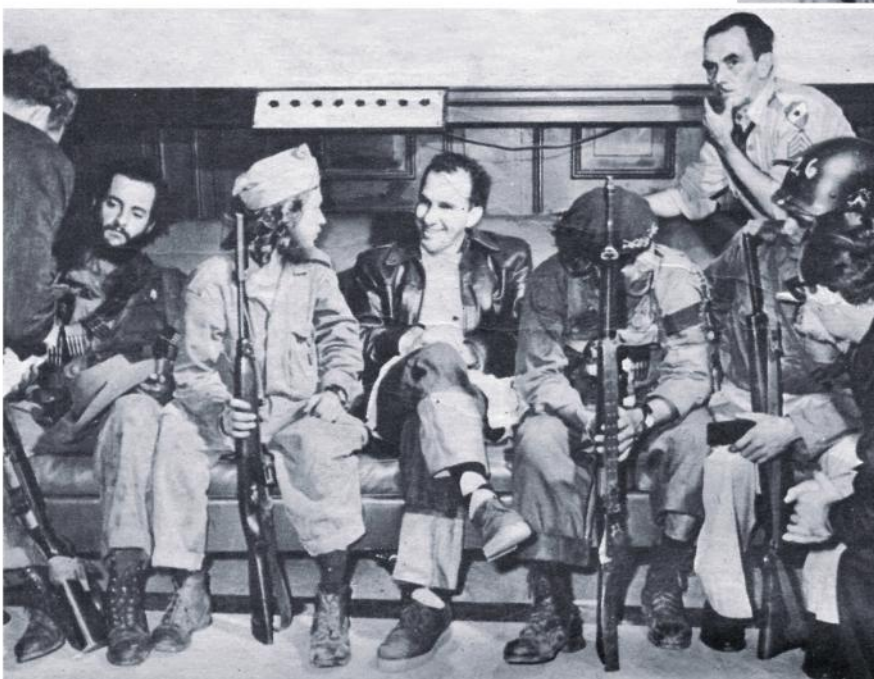
Barquín y los barbudos.