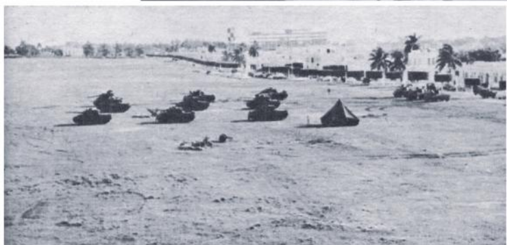
Retirar los tanques.