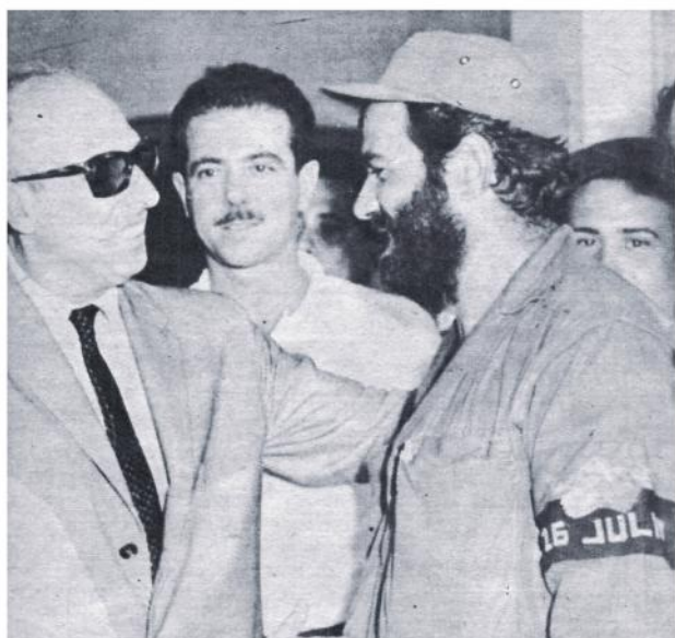
Cepero Bonilla al Gabinete.