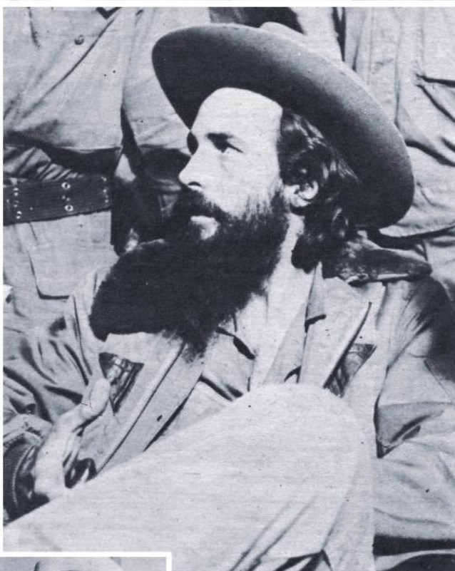
Camilo hacia Oriente.