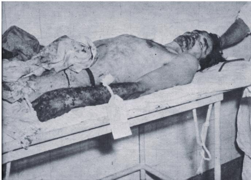
Justicia popular. Los "chivatos", cuyas delaciones ocasionaron tantas víctimas, son odiados por el pueblo. He aquí el cadáver de uno de ellos que ya ha purgado sus culpas.