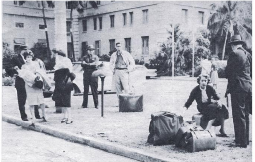
Turistas a deshora.—Turistas norteamericanos que se hallaban en La Habana a la caída del dictador y quedaron bloqueados por la huelga general esperan con sus bagajes en los jardines del Hotel Nacional el momento de abandonar el país.