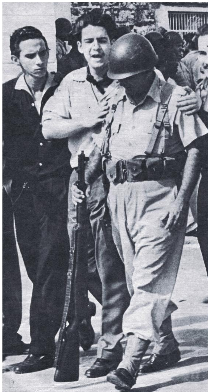
Imagen de la derrota. —El ejército ha depuesto las armas. Este soldado cabizbajo, ciego instrumento del dictador, al ser tratado caballeramente por la muchachada revolucionaria, quizá se da cuenta de la diferencia entre ser mercenario de un tirano a formar parte de un ejército democrático al servicio de la Patria.

Entusiasmo popular. —El mítin de afirmación revolucionaria celebrado por el frente obrero unido en el Parque Central en horas de la tarde del día 2 de enero. A pesar de la agitación que aún reinaba en la capital, una inmensa multitud asistió al acto en que la clase obrera dio rienda suelta a su alegría por el triunfo de la revolución y la caída de los falsos líderes, cómplices del dictador, que la traicionaron.