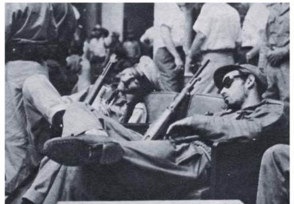
Sueño Reparador.—En los mullidos sillones del Hotel Hilton, a pesar del barullo que reina en torno de ellos, dos soldados del Ejército libertador descansan de sus pasadas fatigas, pero sin desprenderse de sus armas.