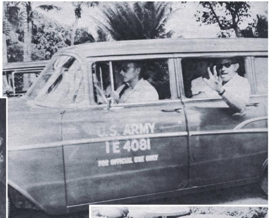
Exodo de turistas.—Como la huelga general había inmovilizado los transportes, los turistas norteamericanos que se hallaban en nuestra capital son trasladados al Aeropuerto por máquinas y oficiales del Ejército Americano.