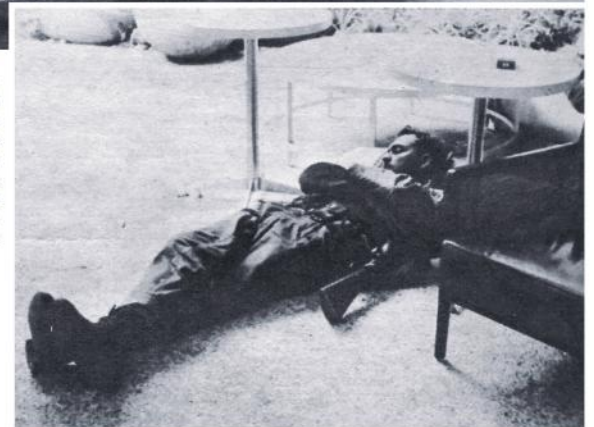
Reposo de un Combatiente.—Vencido por el cansancio, uno de los soldados de la revolución destacado en el Hilton ha encontrado en los alrededores de la piscina un rincón para reposar.