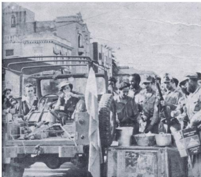
Reponiendo fuerzas. La intendencia del Segundo Frente del Escambray distribuye un sabroso desayuno entre sus hombres que debe saberles a gloria después de sus cruentos combates en la provincia de Las Villas. La escena se desarrolla en la calle 23, no lejos del Instituto del Vedado.