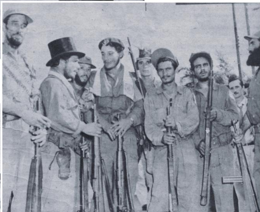
La primer columna de combatientes llegada a La Habana fue la del Segundo Frente del Escambray. Entre los valientes barbudos captados en esta foto, figura uno que ya se ha popularizado por la TV luciendo un sombrero de copa que trocó por su gorra que dió a una muchacha como "souvenir".