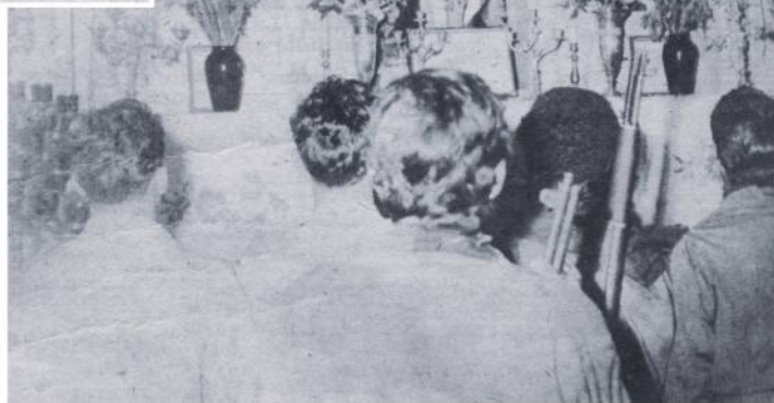
Primeros auxilios. Miembros de las brigadas juveniles del 26 de Julio atienden a un herido en uno de los muchos tiroteos que se produjeron en estos días llevándole a un centro de socorro.