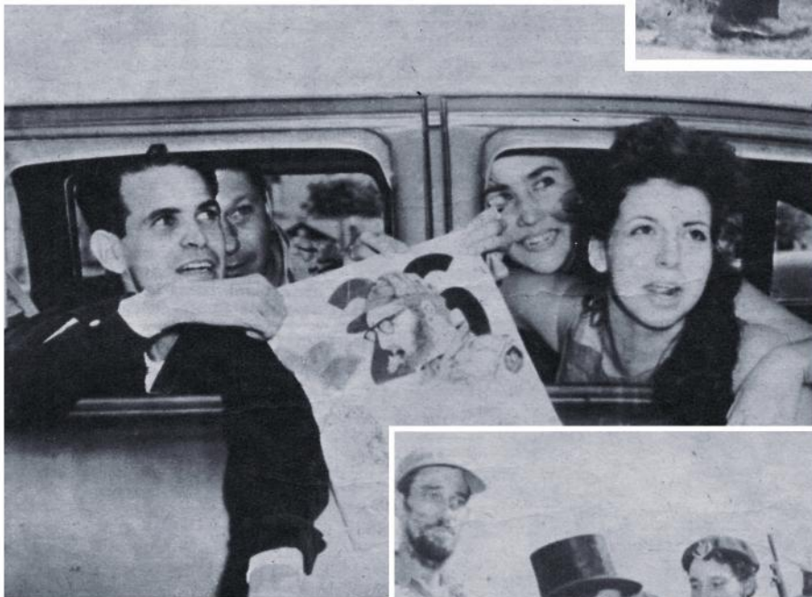
Alegoría de triunfo. Con la alegría reflejada en sus rostros, los ocupantes de este auto exhiben una estampa alegórica del Movimiento del 26 de Julio y de su líder Fidel Castro.