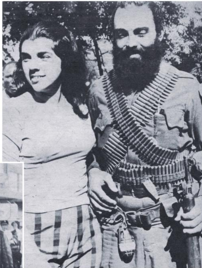
Bellas y barbudos. Los héroes de la liberación de Cuba han sido acogidos apoteósicamente en La Habana. Son frecuentes escenas como esta: un barbudo armado hasta los dientes que sonríe beatíficamente por la admiración que despierta en esta linda muchacha cogida de su brazo.