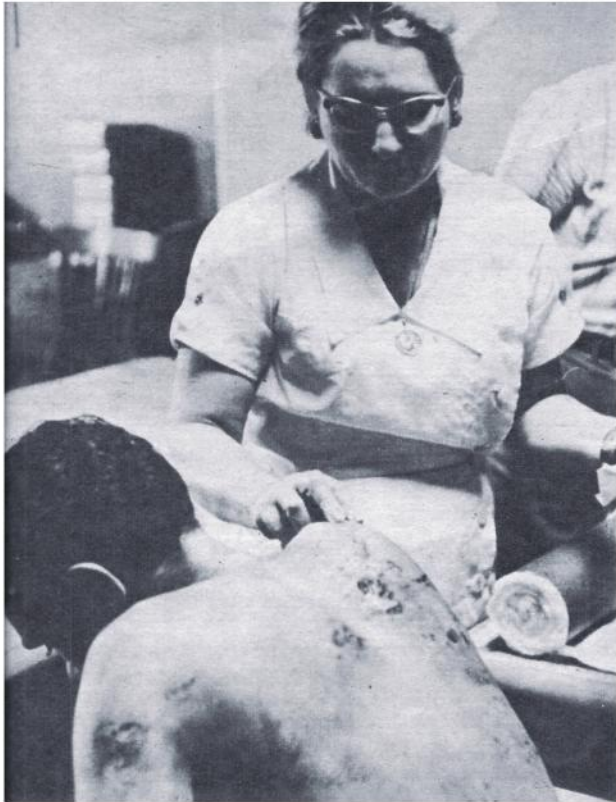
Huellas de la tortura.—Un revolucionario que estuvo recluido en las mazmorras del SIM es asistido por el team médico instalado en el Circuito C.M.Q.