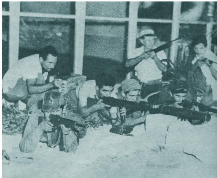
Milicianos del M-26-7 en La Habana y fuerzas del comandante Diego toman posiciones en los alrededores de la Ciudad Deportiva, donde se instaló la base de la columna "Angel Almejeiras", que fue la primera en entrar en la capital.