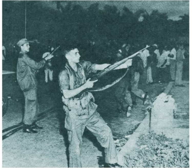
Hombres del anterior régimen son acorralados en un reparto de la capital. Los milicianos del M-26-7 se aprestan a tomar posiciones ante la mirada curiosa del numeroso público.