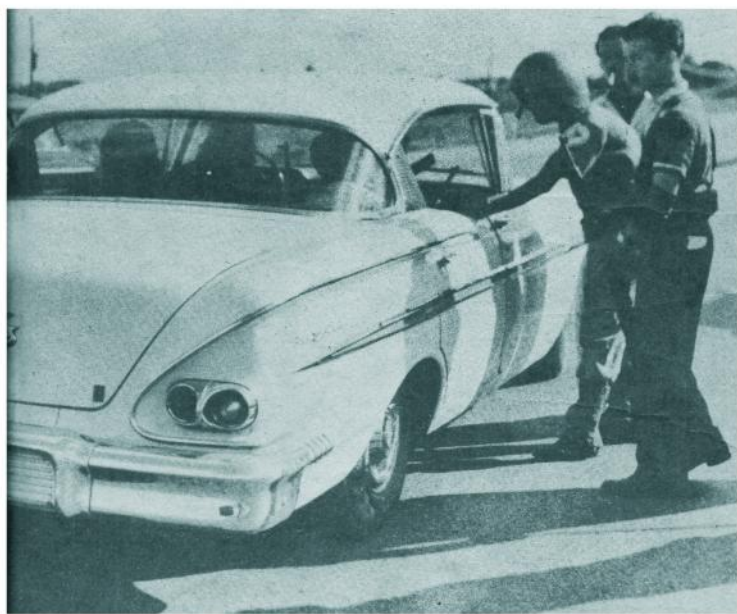
Milicias del 26 de Julio patrullan la Avenida de Rancho Boyeros registrando los automóviles y solicitando contraseñas. Esta foto corresponde a la milicia destacada en la COCO.