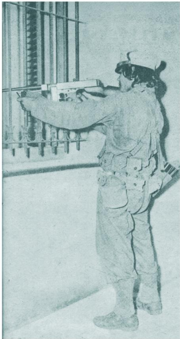
Uno de los combatientes de la columna "Angel Almejeiras", del comandante Diego, introduce la boca de su ametralladora por la ventana de una casa donde se supone pueden refugiarse hombres de la derrocada tiranía.