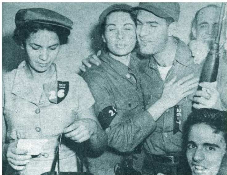
En la Ciudad Deportiva donde se instaló el campamento del comandante Diego se producen escenas de intenso júbilo entre los combatientes de la misma y las milicias habaneras. La de la derecha es una ex-profesora de inglés que marchó a la zona de Madruga para incorporarse a la columna "Ángel Almejeiras".