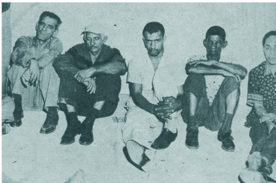
Otro aspecto de los detenidos en la Ciudad Deportiva acusados de ser confidentes del anterior gobierno del general Batista.