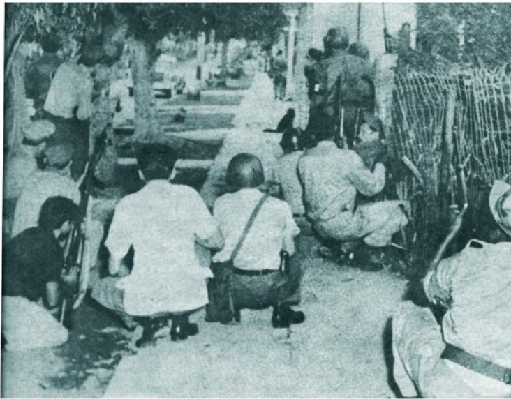
Fuerzas de la milicia del 26 de Julio rodearon la casa. El tiroteo fue nutrido e intenso, prolongándose desde las dos hasta las siete de la tarde del sábado. Al finalizar el combate el saldo era de cuatro muertos: dos de los atacantes y los dos porristas acorralados.