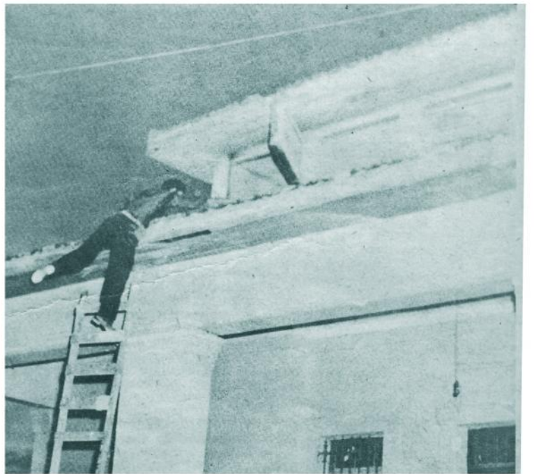
Uno de los arriesgados integrantes de las milicias del M-26-7 en la capital, realiza un peligroso ascenso, tratando de desalojar a elementos batistianos que se habían hecho fuertes en esta casa. Poco antes otro miliciano había sido ametrallado al asomarse a la misma ventana.