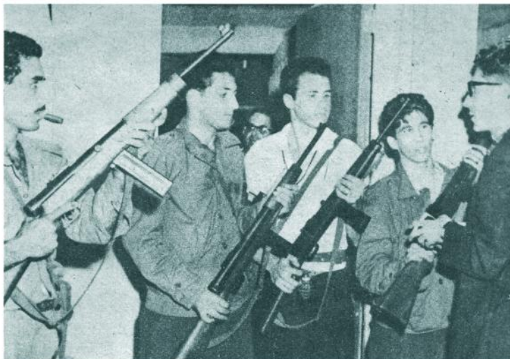
La disciplina es estricta en la Ciudad Deportiva. La identificación resulta rigurosa para poder entrar en la Comandancia, instalada en el piso superior del Coliseo.