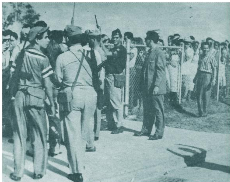
A la entrada de la Ciudad Deportiva numerosas personas se apiñan tratando de ver a sus familiares. Hombres del M-26-7 cuidan el orden, que en todo momento resulta estricto.