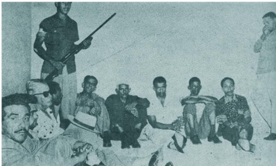
Esta foto corresponde a los primeros "chivatos" del derrocado régimen capturados por las fuerzas rebeldes del comandante Diego. Aquí aparecen en uno de los locales de la Ciudad Deportiva.