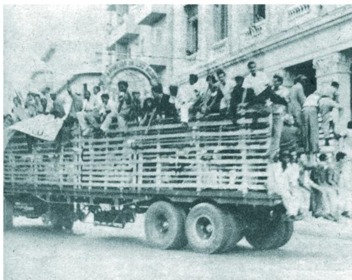
El pueblo confundido con las milicias del M-26-7 ocupó distintos vehículos para recorrer las calles de la Capital mostrando su entusiasmo y cuidando el orden. La disciplina fue estricta en todo momento. El pillaje fue reprimido enérgicamente.