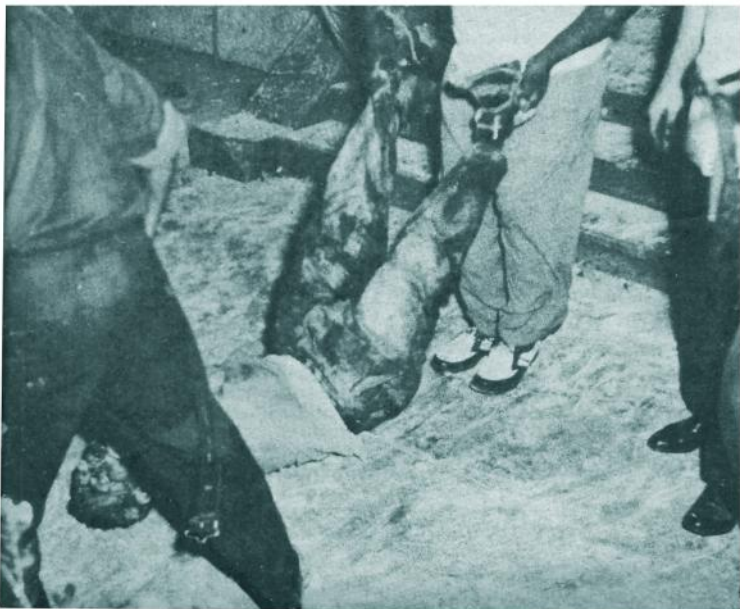
El cadáver de uno de los porristas muertos es extraído de la casa donde se había hecho fuerte en el Reparto Almendares. El hombre no fue identificado.