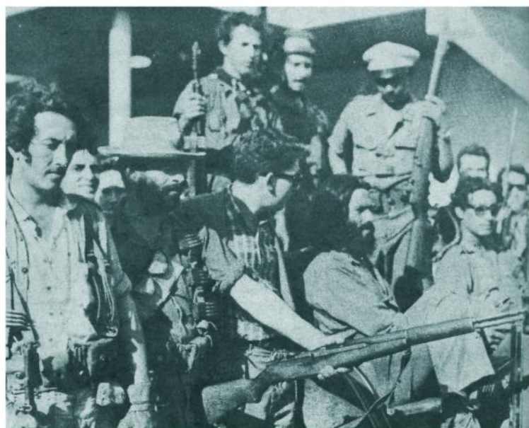
Otro aspecto de las fuerzas rebeldes acampadas en la Ciudad Deportiva.