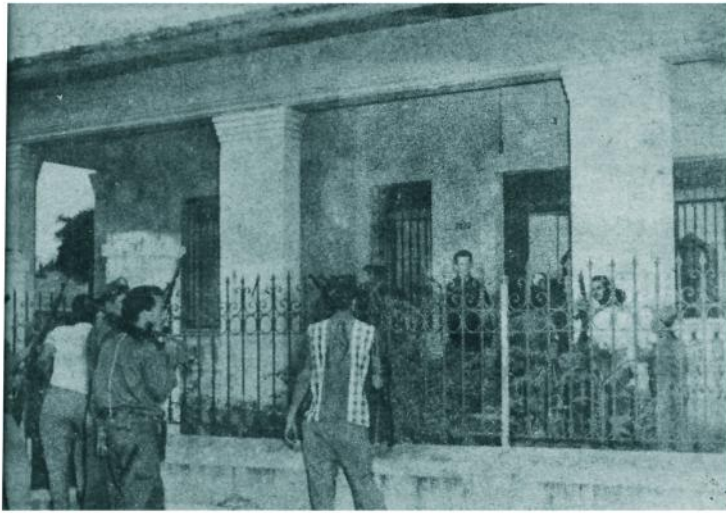
En la parte superior de esta casa, ubicada en 70 y 23, en el Reparto Almendares, se hicieron fuertes dos hombres de acción del derrocado régimen. Horas después eran muertos.