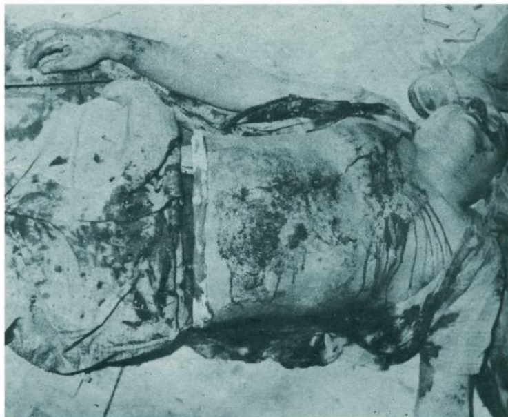
Otro de los hombres del anterior gobierno que hizo resistencia a las fuerzas rebeldes que lo habían acorralado.