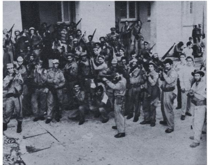
Combatientes del II Frente Nacional del Escambray, acampados en el Instituto del Vedado y que contribuyeron poderosamente a mantener el orden en la capital de la República.

—Nosotros —dice— atacábamos con una fuerza de setenta hombres. Sucesivamente ocupamos a San Fernando de Camarones, Cumana-yagua, San Juan de los Yeras, los ingenios Soledad y Hormiguero.