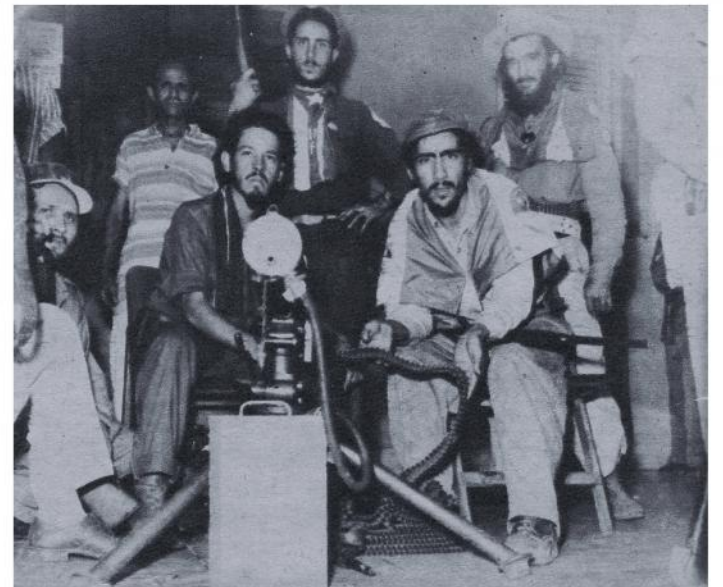
He aquí el tipo de ametralladora con que combatían a la tiranía los bravos soldados a las órdenes del comandante Eloy Gutiérrez Menoyo.

—Un día —refiere el comandante Gutiérrez Menoyo— en Guanayara, barrio de Guaniquical, Trinidad, rodeamos al ejército. Al día siguiente, la acción continuó en "Manantiales" y se prolongó a "Dos Bocas". Resultado: de ciento y tantos soldados que habían entrado en el combate, sólo regresaron a sus bases dieciséis. Ocupamos allí gran cantidad de equipos militares.