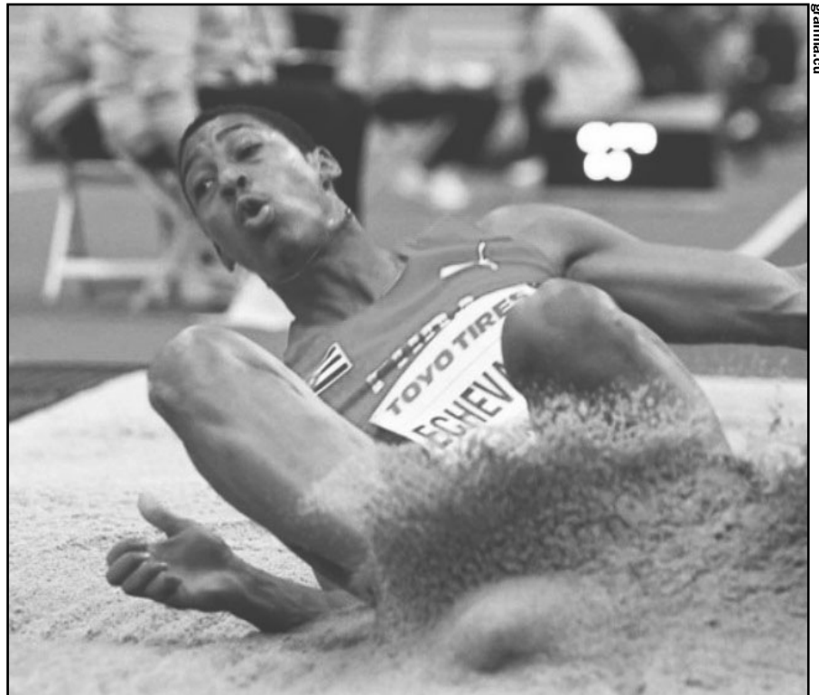
EL saltador de longitud Juan Miguel Echevarría asiste a otro estreno de apreciable nivel. A él, y a los mozalbetes de salto triple, les dicen los hijos de Aries, el Dios de la Guerra, por su nivel de perseverancia ante importantes adversarios.

En el foro mundialista de Londres 2017 los ensalces pertenecieron en 100 metros: Usain Bolt-JAM