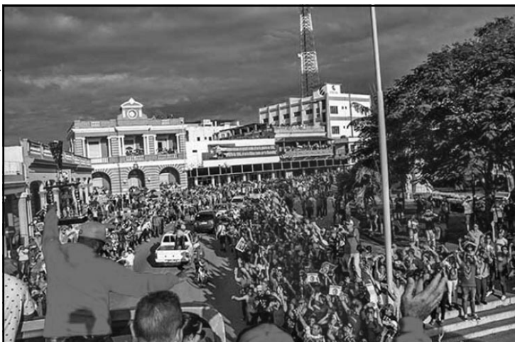
En una fiesta de pueblo se convirtió la caravana del equipo campeón de Santa Clara hasta Las Tunas.

que dio al triunfo de Las Tunas. “Me siento un tunero también. El pueblo se lo esperaba, el equipo jugó bien, supimos hacer las cosas ante un rival difícil que no se dio por vencido hasta el último momento y salió el título”, declaró quien dio pasos sólidos rumbo a la conformación del equipo de las cuatro letras a otros eventos del 2019. Fueron aplastantes en los play off , primero 4-1 frente a un Ciego de Ávila que vendió cara su derrota, por encima de ese marcador global, y luego ante los villaclareños, que dieron un tremendo salto de un año a otro de la mano del otrora estelar torpedero Eduardo Paret. Las Tunas dio muchos motivos para una fiesta gigantesca, desde ese último out del quinto partido de la gran final. Primero en Santa Clara, luego en el recorrido de casi 400 kilómetros. Por cierto, llegaron imágenes del pueblo de Ciego de Ávila saludando a la caravana tunera al paso por esa urbe del centro del país, un gesto noble. Y en la capital provincial del Balcón del Oriente fue el acabose, como merecían todos, peloteros y afición. Tuneros: ¡Campeonísimos... de la gorra a los spikes!