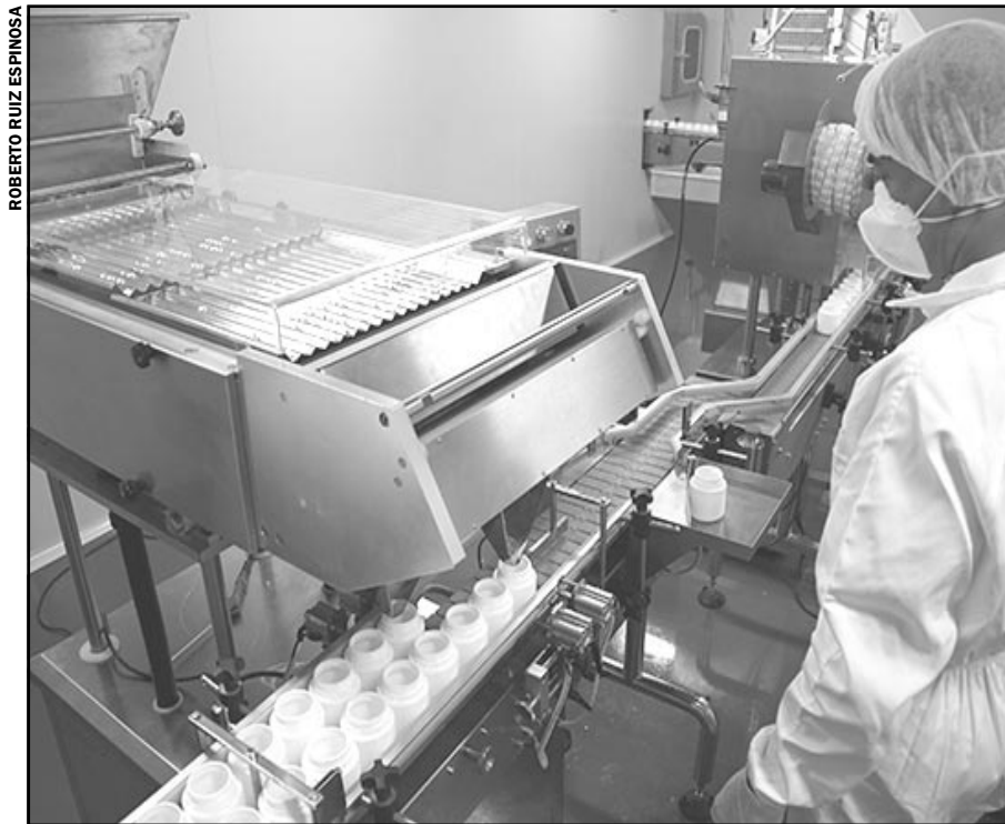
La planta cuenta con una capacidad de producción de 45 000 cápsulas por hora.