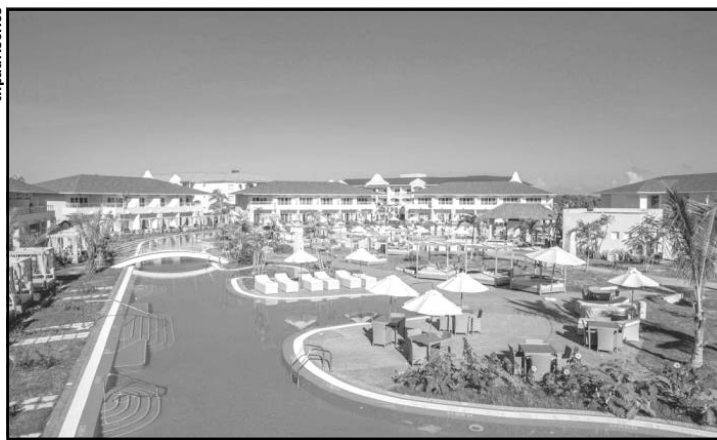
El Paradisus Princesa del Mar, del balneario matancero, nominado este año a los World Travel Awards, fue ganador y representante de Cuba en la pasada edición del certamen, junto al Hotel Nacional y al Gran Manzana Kempinski.