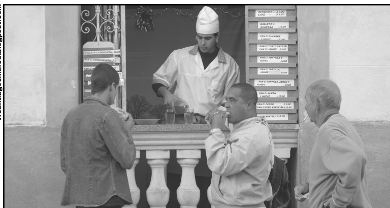
Podrán establecer relaciones de compraventa con personas jurídicas estatales cubanas y extranjeras radicadas en Cuba, mediante contratos y cuentas bancarias.

Estas medidas se suman a las publicadas a principios de diciembre último, que incorporaron ajustes reclamados por los TCP sobre disposiciones adoptadas a mediados de 2018 y que entraron en vigor a finales del mismo año, como parte de la implementación de la política de perfeccionamiento de esta actividad.