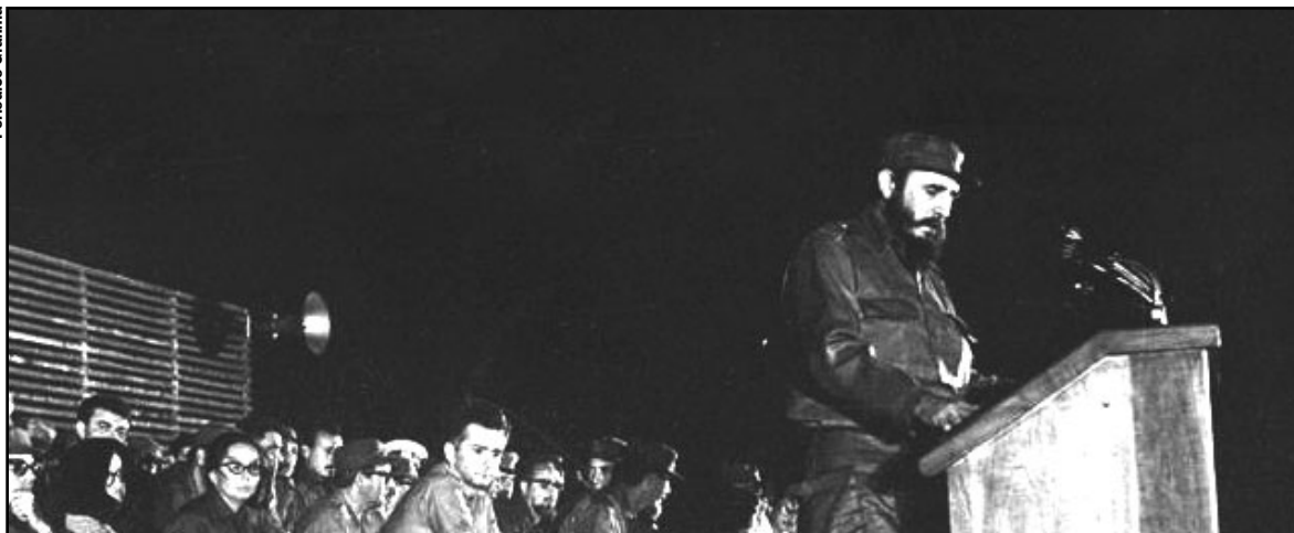
Fidel en Demajagua, 10 de octubre de 1968.