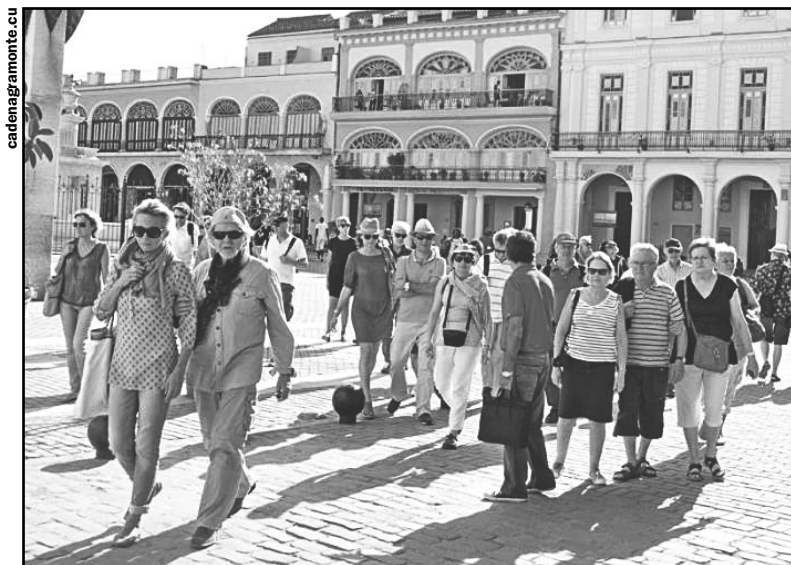
El turismo nacional cerró el año 2018 con 42 por ciento de repitencia, índice bastante alto que refleja la complacencia de quienes nos visitan.

Cuba sobrepasó el millón de visitantes extranjeros en lo que va de año y sigue por más, a pesar de las restricciones del bloqueo estadounidense