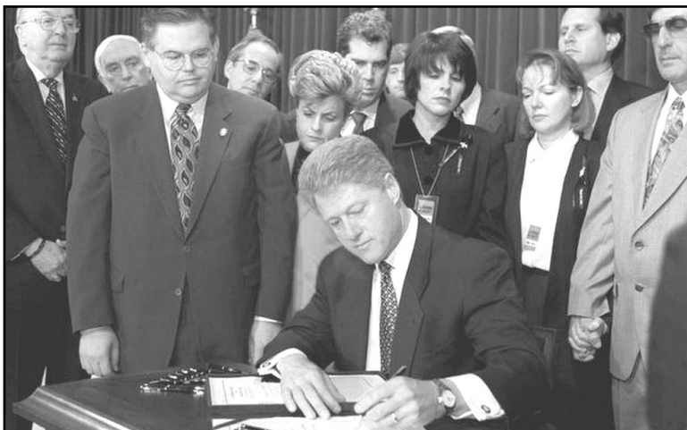
Bill Clinton firma la Ley Helms-Burton, engendro jurídico que articula en una sola pieza las medidas de guerra económica con aquellas encaminadas a alentar la subversión interna.

la persecución al comercio exterior cubano.