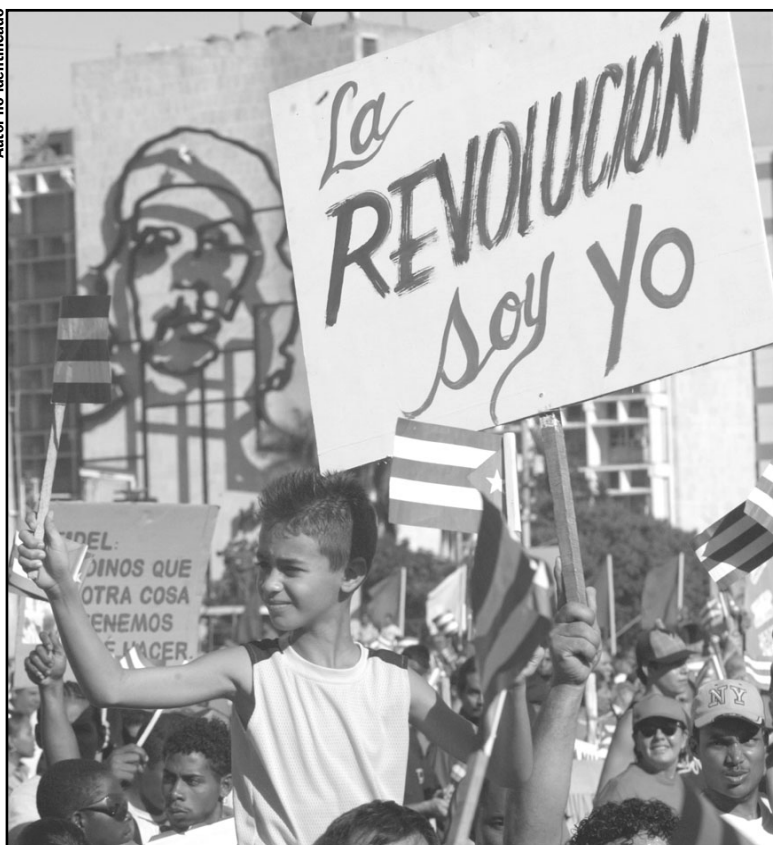
El pueblo cubano, dueño de su destino, sigue el camino que se ha trazado.