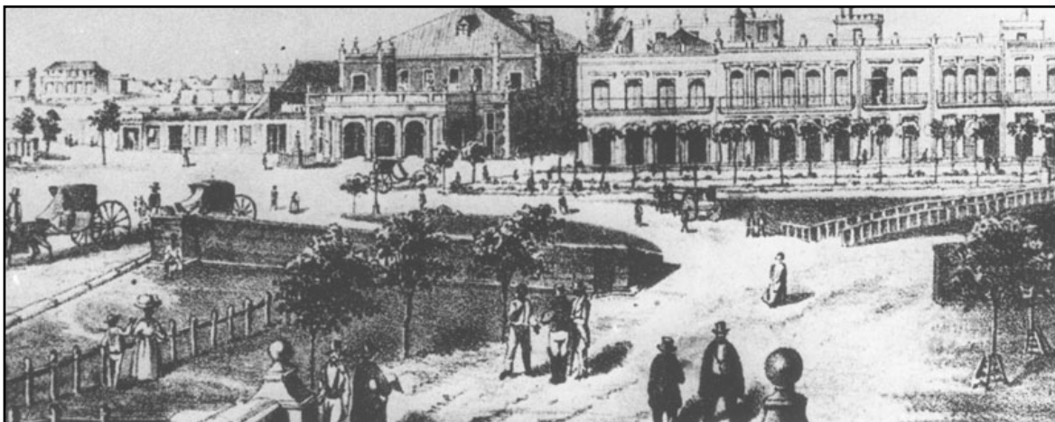
Paseo de Isabel II y Teatro Tacón, desde la puerta de Monserrate. Grabado de la época.

Los carretones y volantas, junto a los vendedores ambulantes con sus característicos pregones en el medio centenar de las estrechas calles, muchas con toldos, y el repicar de las campanas de las iglesias, ponían un sello distintivo a la ciudad.