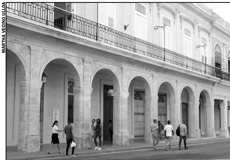
Martí pasa un tiempo en la casa de Rafael María de Mendive, entonces Prado 88, y estudió en el Colegio San Pablo, del propio maestro, en Prado 86, esquina Ánimas, actual 266.

El día 12 la ciudad de Bayamo es incendiada por sus propios pobladores antes de caer en manos españolas, y una semana después el adolescente José Martí publica su primer artículo periodístico en El Diablo Cojuelo , editado en la imprenta El Iris , de Obispo, número 20. El 23 aparece su drama patriótico y simbólico Abdala , en La Patria Libre , también editado en El Iris .