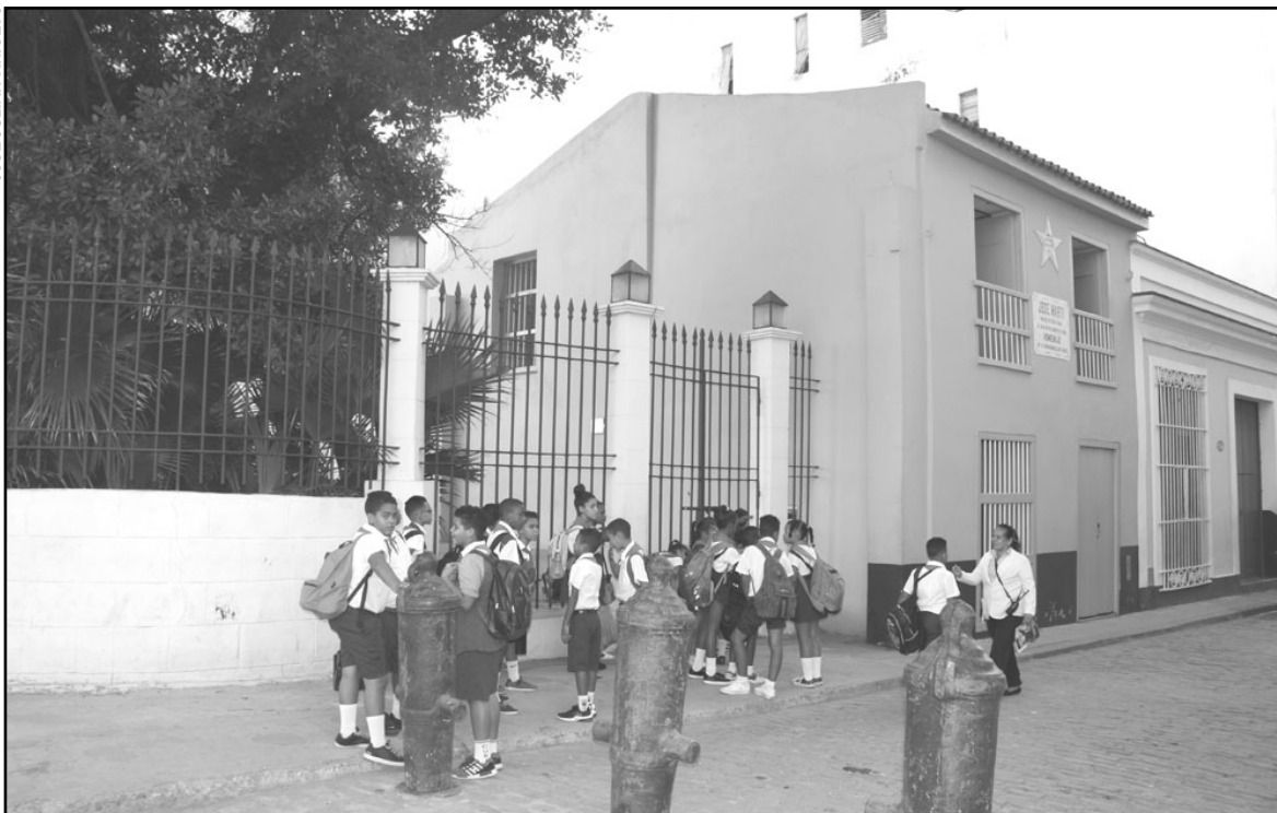
En la calle Paula, número 41, nació José Julián, el viernes 28 de enero de 1853, un lugar que aman y visitan los cubanos de todas las edades.