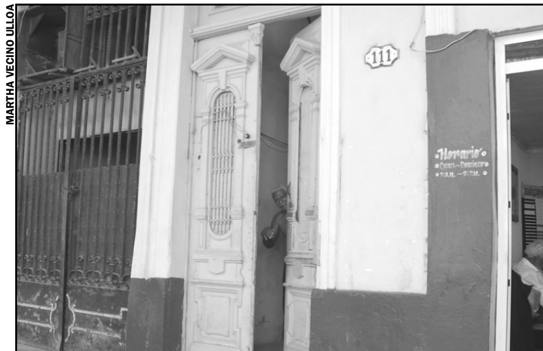
En 1866, sus padres y hermanas se trasladan para Refugio 11, hoy 111.