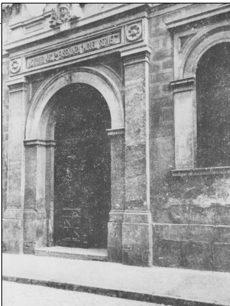
Instituto de Segunda Enseñanza de La Habana donde concluyó sus estudios de Bachillerato.

Seis días más tarde, durante un acto de homenaje al violinista cubano Rafael Díaz Albertini, en el Liceo de Guanabacoa, exclama con tal desenfado la palabra patria ante el capitán general Ramón Blanco, que al militar español no le queda más remedio