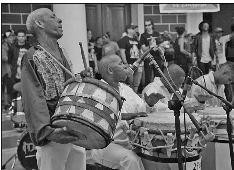
La 26ª edición de las Romerías de Mayo ofreció al público un programa artístico diverso en la gran fiesta del arte joven, en Holguín.