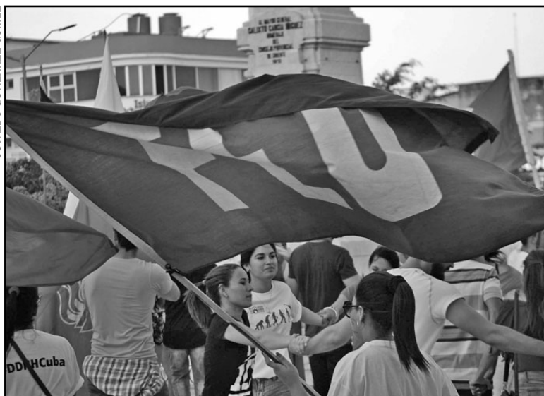
Jóvenes universitarios en el evento Abrazos contra el bloqueo, en el parque Calixto García.

El evento constituye un encuentro abierto a la solidaridad desde hace más dos décadas; invita a la unidad entre los pueblos más allá de etnias y enaltece la relevancia del pasado en la construcción de la realidad actual, idea recogida en su lema identificativo: Porque no hay hoy sin ayer.