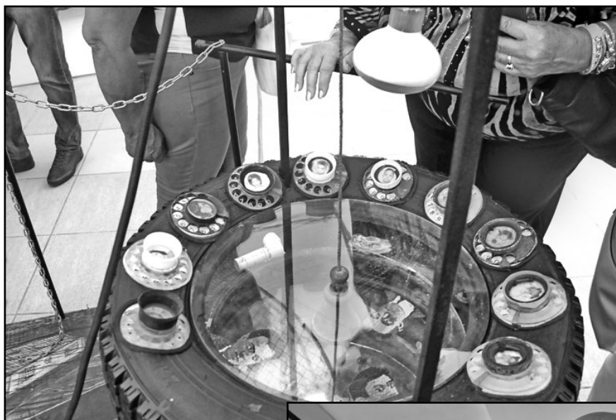
Las fotos recontextualizadas cuentan otra historia.

Luego de 22 años de haber sido presentada en el recinto de La Cabaña, a propósito de la VI Bienal de La Habana, la pieza se insertó en el MNBA como parte de la muestra La posibilidad infinita. Pensar la nación .