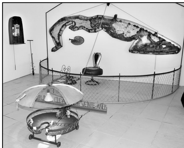
Panorámica de la muestra expositiva Taller de Reparaciones .

Acercamiento a la instalación Taller de Reparaciones que expuso René Francisco Rodríguez en el Museo Nacional de Bellas Artes