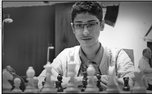
El joven talento iraní Alireza Firouzja muestra muy bien su clase en esta bella partida.