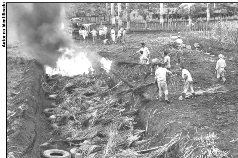
En 1971 se desató el virus de la fiebre porcina africana y hubo que sacrificar medio millón de cerdos.

Hasta diciembre de 1999 el Gobierno Revolucionario tuvo que invertir 1 529 millones 27 958 dólares y 430 millones 261 536 pesos en enfrentar los daños y perjuicios causados por las agresiones biológicas. Hasta diciembre de 2000 había gastado 2 158 millones de dólares, con gastos adicionales cada uno de los años en el orden de los 59 millones de dólares para enfrentar este tipo de agresiones.