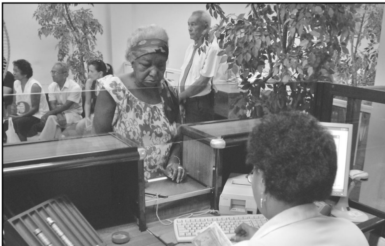
Todas las pensiones inferiores a 500 pesos se incrementan. Esto abarca a 1 281 523 personas, con un costo estimado anual de más de 700 millones de pesos.