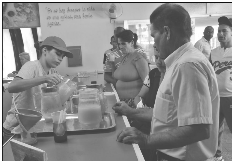
Parejo al incremento salarial, para evitar inflación, debe existir una garantía en la circulación minorista, potenciando bienes y servicios que repercutan en la calidad de vida de la población, recalcó el Presidente cubano.

De todas maneras yo quiero decirlo en público, porque también expresa el altruismo de