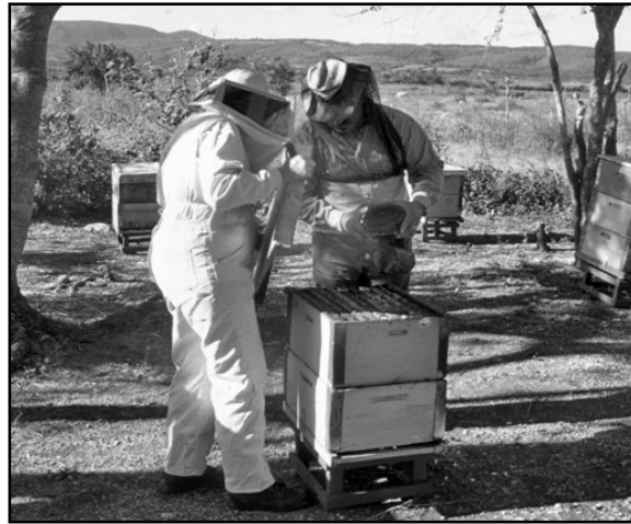
Apiario en Matanzas.