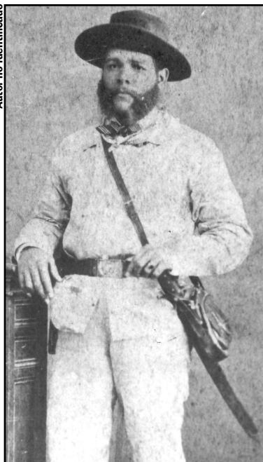
Sin recursos para fletar una expedición, desesperado, Maceo se quedó esperando en Jamaica por una nave prometida que nunca fue a recogerlo.

pésima coordinación entre los grupos conspirativos, incidió en que, a inicios de 1880, ya estaba totalmente desarticulado el movimiento insurreccional en el oeste cubano.