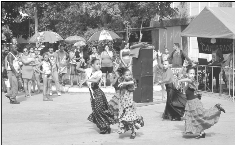
En los Consejos Populares de la Isla de la Juventud, proyectos culturales comunitarios amenizaron las tardes del período vacacional.