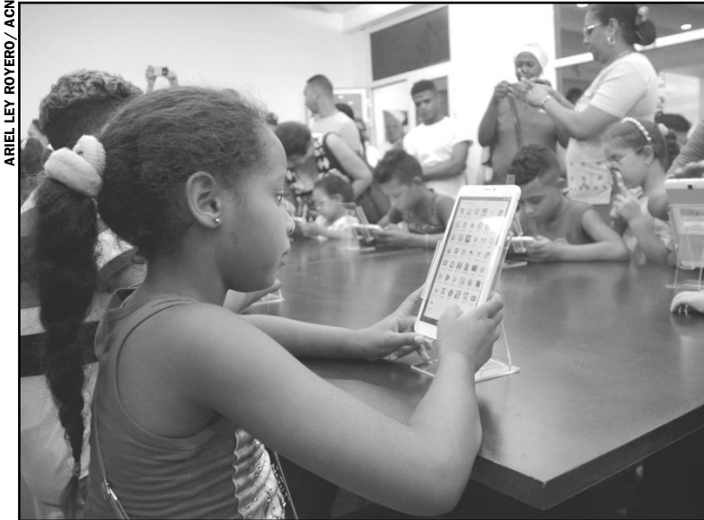
ARIEL LEY ROYERO / ACN