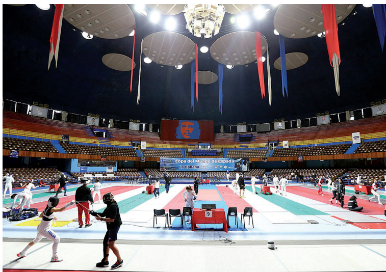
La instalación de Vía Blanca y Boyeros ha sido sede de eventos internacionales de muchos deportes.

En el Salón del Deporte Cubano, Reyes dijo que el coliseo es su segunda casa. “Como mismo extraño al Prado donde nací, o al Malecón, cuando estoy más de una semana sin venir al coliseo lo extraño, porque representa un sitio muy especial. Es expresión de éxito, de los logros del deporte cubano”.