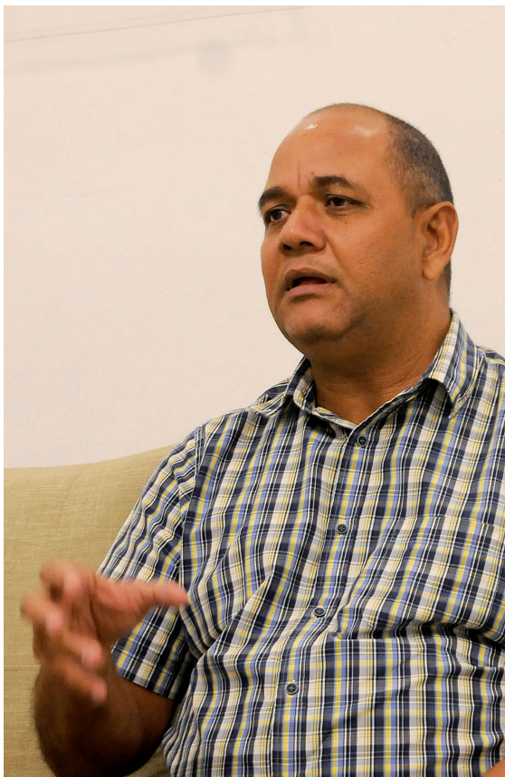
Reinaldo García Zapata, presidente del Gobierno provincial, dice que aunque no descarta el uso de las redes sociales para comunicarse con el pueblo, prefiere el cara a cara, antiguo pero insustituible.