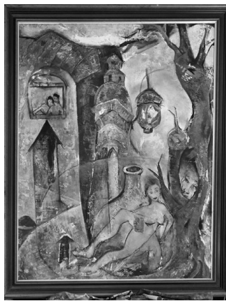
Ningún elemento humano y de la naturaleza le resulta ajeno.

hace tiempo, sentí el síndrome del nido vacío, comencé a escribir el poemario Armisticio . Trata sobre alguien que desde