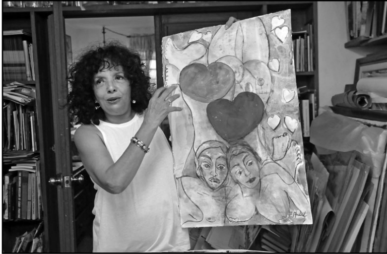
“Entreguemos lo más puro del alma”, propone la artista y poeta.