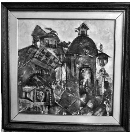
La Habana motiva su rica imaginación.