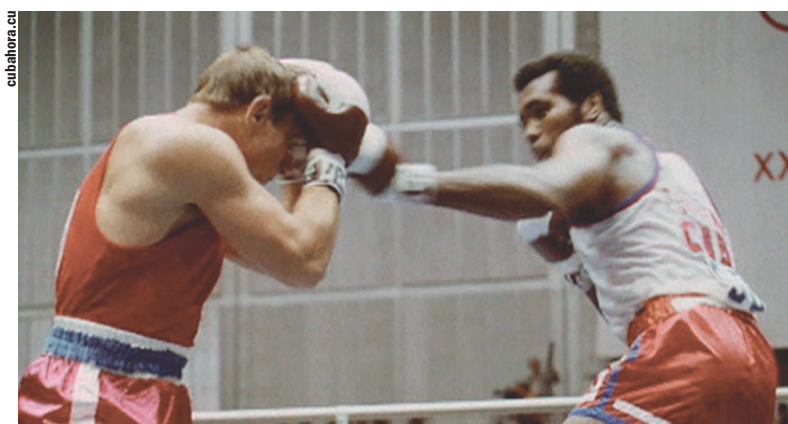
El legendario boxeador, ya fallecido, Teófilo Stevenson: tricampeón en los de Moscú 1980, tras haberlo logrado en Múnich 1972 y Montreal 1976.