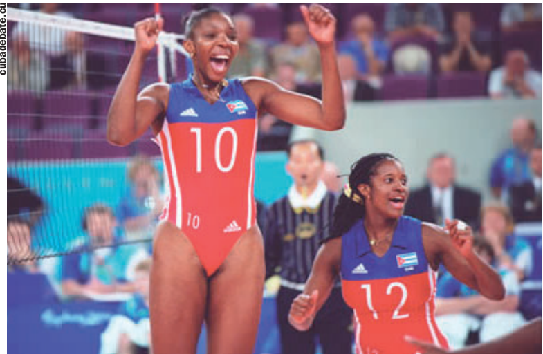
Las voleibolistas cubanas redondearon tres coronas en Sídney 2000.

A pesar de esos títulos ellas parecían tener un futuro empañado no mucho antes de los Juegos. Eugenio George, el gran estratega ya fallecido, fue llamado de nuevo a filas para intentar el rescate. Lo consiguió