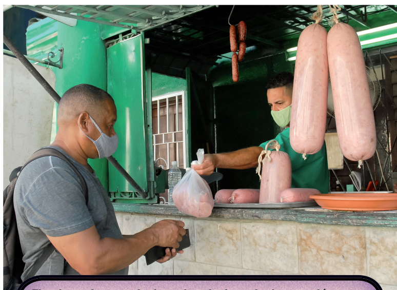
El ordenamiento no ha logrado solucionar la desconexión entre precios y salarios, debilidad estructural de la economía cubana.

“Las tensiones de liquidez, la falta de divisas afecta el abastecimiento de la red minorista, incluidos los productos de demanda básica como aceite, puré de tomate y otros bienes. Ahora, pongo un ejemplo, una botella de aceite en Granma, según el monitoreo de precios que estamos realizando, cuesta 400 pesos, pero si hubiera ese producto, esto no sucedía. ¿Por qué la carne de cerdo cuesta 130 pesos la libra? Porque sencillamente no hay carne en el mercado. La causa no es solo