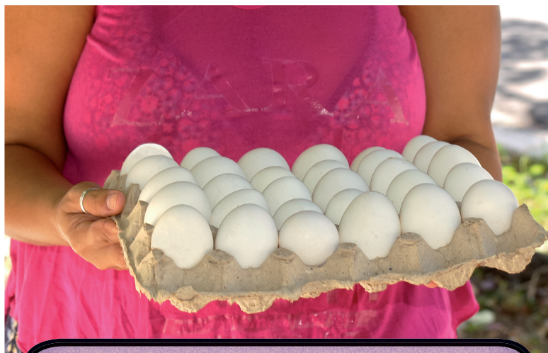
¿Pondrán las gallinas huevos de oro?

“No obstante, tenemos que seguir corrigiendo todo lo que haya que corregir. Este no es un proceso terminado, lleva evaluaciones y ver realmente los impactos. Tenemos el deber de observar