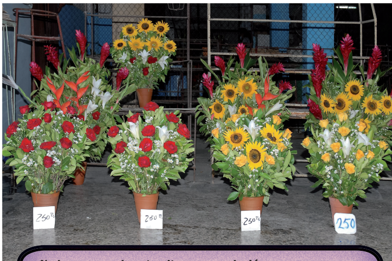
Nada escapa a la estrepitosa especulación.

“En tal sentido, hemos realizado ajustes y correcciones necesarias, sin desconocer los