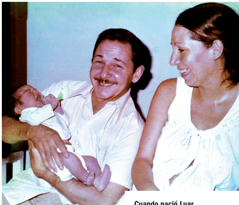
Cuando nació Luar.