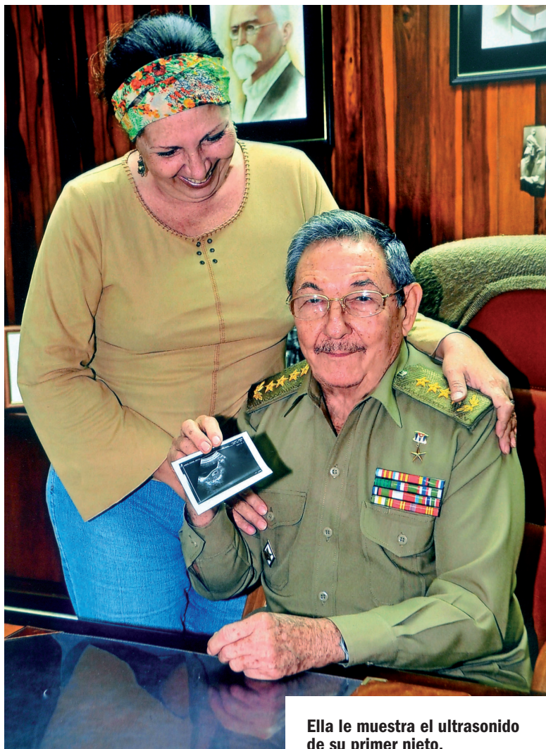
Ella le muestra el ultrasonido de su primer nieto.

José Luis Tasende fue uno de los asaltantes al Moncada, asesinado el 26 de Julio de 1953. Era amigo de Fidel desde la adolescencia, y es por eso que conoció