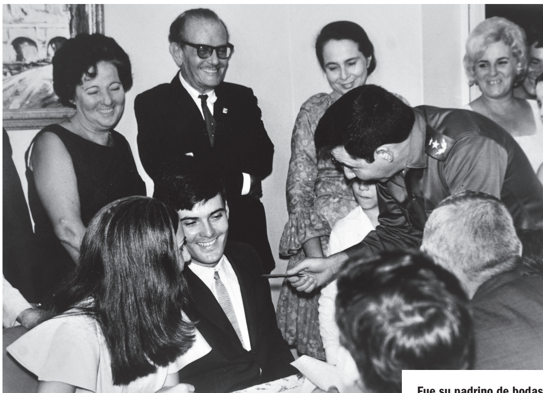
Fue su padrino de bodas.