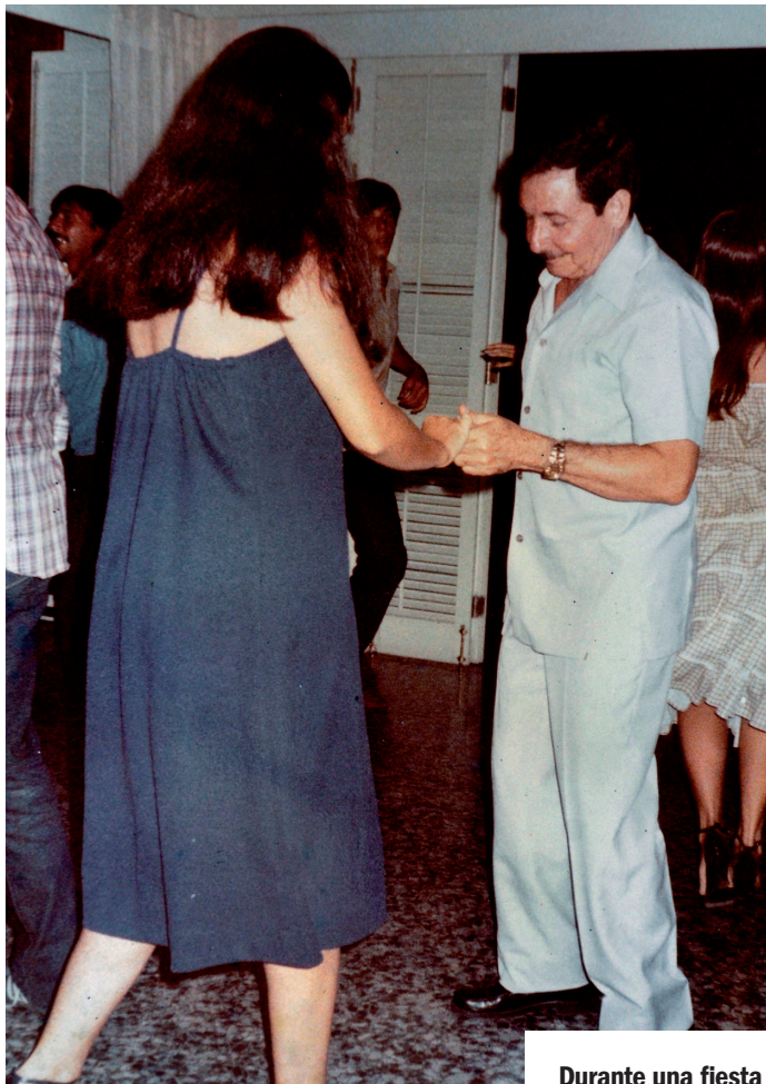
Durante una fiesta familiar.